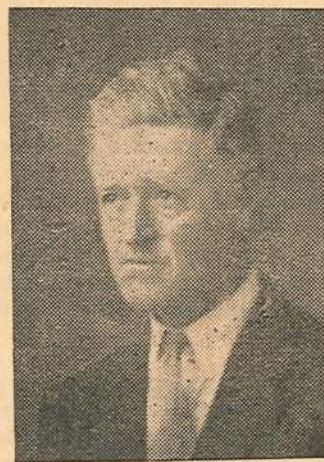
Cuyo segundo aniversario de su muerte se cumple el 28 de los corrientes.