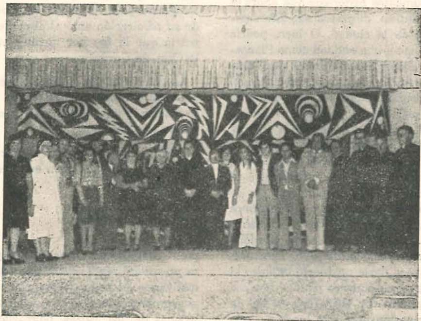
Homenaje en el Liceo

e)- Que es un deber de entidades como las "BRIGADAS CIVICAS Y JUVENILES", exaltar las virtudes y loar los ejemplos cívicos de los prominentes hijos de El Santuario,