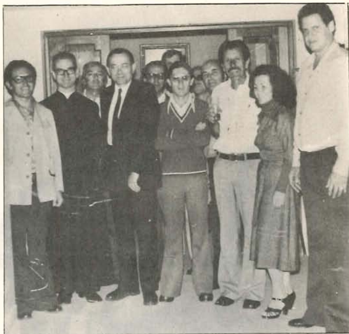
Visita a EL SANTUARIO el presidente mundial de la Sociedad San Vicente de Paúl, Joseph Ruast. En la gráfica aparecen en compañía de su comitiva y de algunos miembros de la institución en El Santuario.

¿Cómo?. La Sociedad de Mejoras Públicas que preside el entusiasta Orlando Vásquez Aristizábal ha dispuesto que las Fiestas del Retorno se realicen del cinco al siete de enero próximo y que su producido sea destinado al hospital.