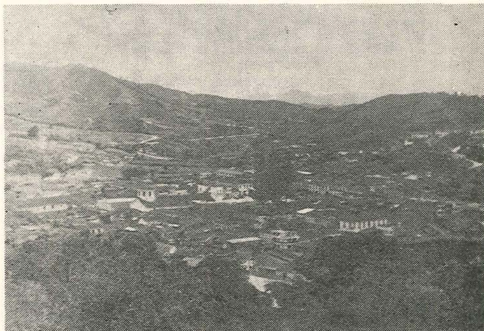
Hermosa panorámica de El Santuario y pensar que no tiene Hospital.