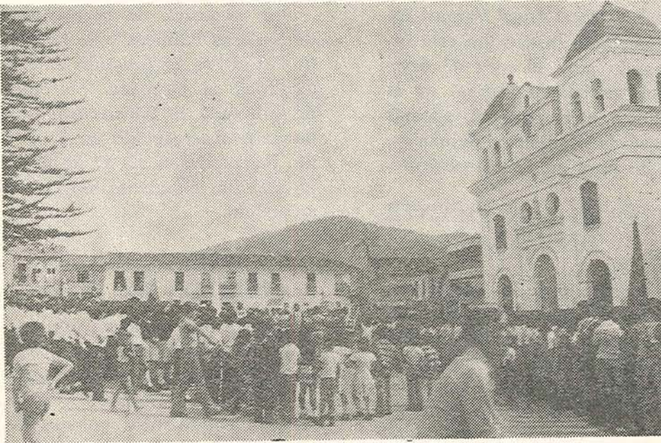
Plaza principal de El Santuario, habitado por gentes llenas de fe en el futuro. En la actualidad no cuenta con Hospital

Conviene que el señor Alcalde Municipal le de una miradita a los libros respectivos para averiguar por dónde andan esos dineros que ciertamente sirvieron para el arreglo de muchas calles. Si ese fondo ya se terminó, pues que claramente se le diga a la ciudadanía. Si quedó en otras manos o en otros bolsillos, que se adelanten las investigaciones del caso. Tiene la palabra, señor Alcalde.