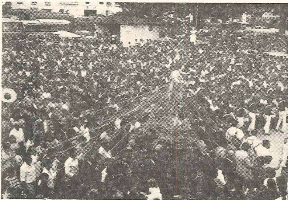
Multitudinaria manifestación de fe y amor, en la fiesta del "Sagrado Corazón de Jesús" que año tras año celebran con todo júbilo los conductores de El Santuario.

Por qué será esto? Porque esta devoción, no es una devoción más. No es en la vida cristiana una especie de cosa accidental que puede suprimirse sin que me pase nada; es algo de suma trascendencia. S. S.