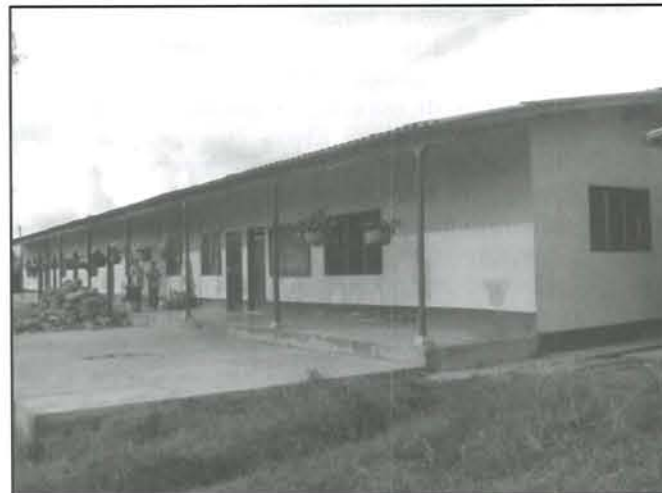
Aspecto de la escuela de la vereda Potrerito.

En la segunda década del siglo XX, aproximadamente en el año de 1914, en terrenos donados por Rafael Giraldo, se construyó la primera escuela, en tapia y teja de barro, con dos salones como aulas de clase, una pieza como dormitorio para la maestra y la cocina. De las primeras profesoras que se traen a la memoria por parte de los octoge-