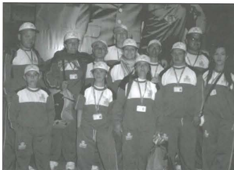
Grupo de jóvenes y maestros participantes en las olimpiadas Fides-Compensar.

Gran triunfo de deportistas de Alifisán. Del 24 al 28 de octubre se realizaron en Bogotá las III Olimpiadas Iberoamericanas Fides-Compensar, con la participación de deportistas de nueve países.