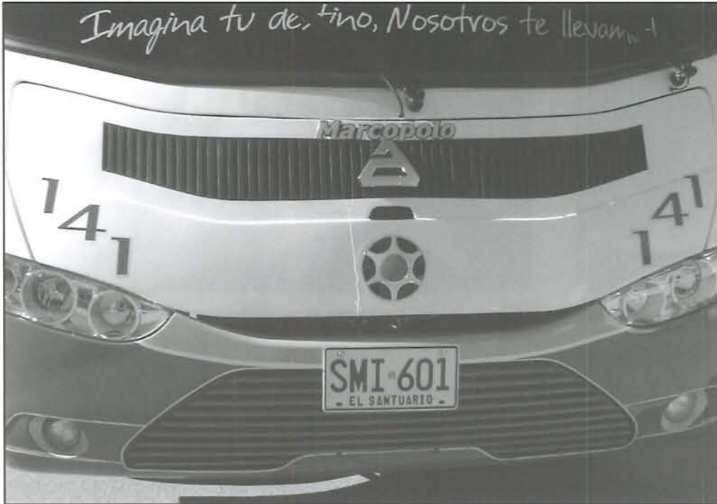
Estas son las letras que identifican los vehículos matriculados en El Santuario.