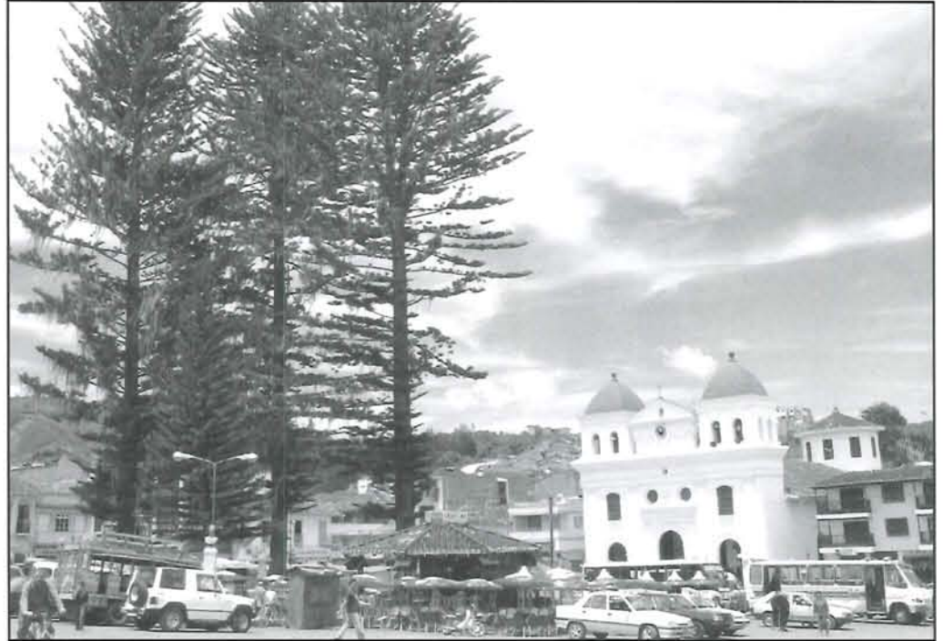
Dentro de poco, imagen para el recuerdo...

Al estudio de suelos y de las redes de acueducto y alcantarillado sigue el corte de las araucarias, quizás, con la supresión del kiosco, las mayores críticas que ha recibido este proyecto de la administración del alcalde Raúl Gómez Giraldo.