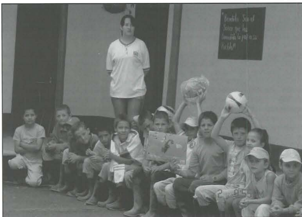
Más atención a la población infantil y juvenil

La campaña ha arrojado los frutos esperados ya que se tiene la experiencia de veredas como Vargas y Pantanillo que fueron bastante afectadas por esta plaga