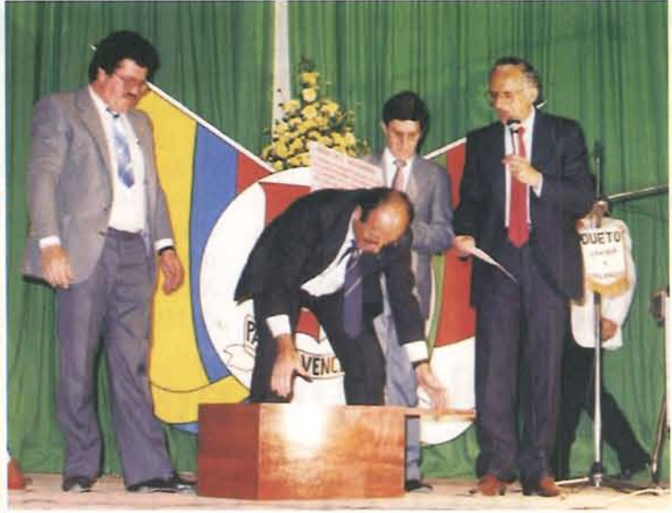
En el sesquicentenario cerrando la urna del recuerdo.