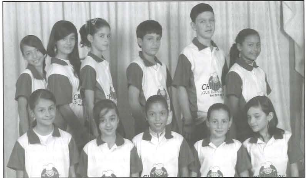
Grupo de deportistas participantes en departamentales escolares.

El trabajo realizado por Indeportes Antioquia, Cordepor y el Infordes, dio frutos positivos y se logró el objetivo de concentrar a los niños y niñas del oriente antio-