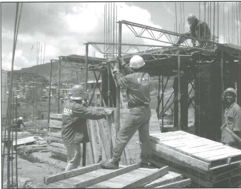
En diciembre terminan la construcción del nuevo comando.

En el mes de diciembre será inaugurado el nuevo edificio del Comando de Policía construido a la entrada de la población cerca de la Autopista Medellín-Bogotá, anunció el alcalde Raúl Gómez Giraldo, quien agregó que tendrá un costo de $800 millones.