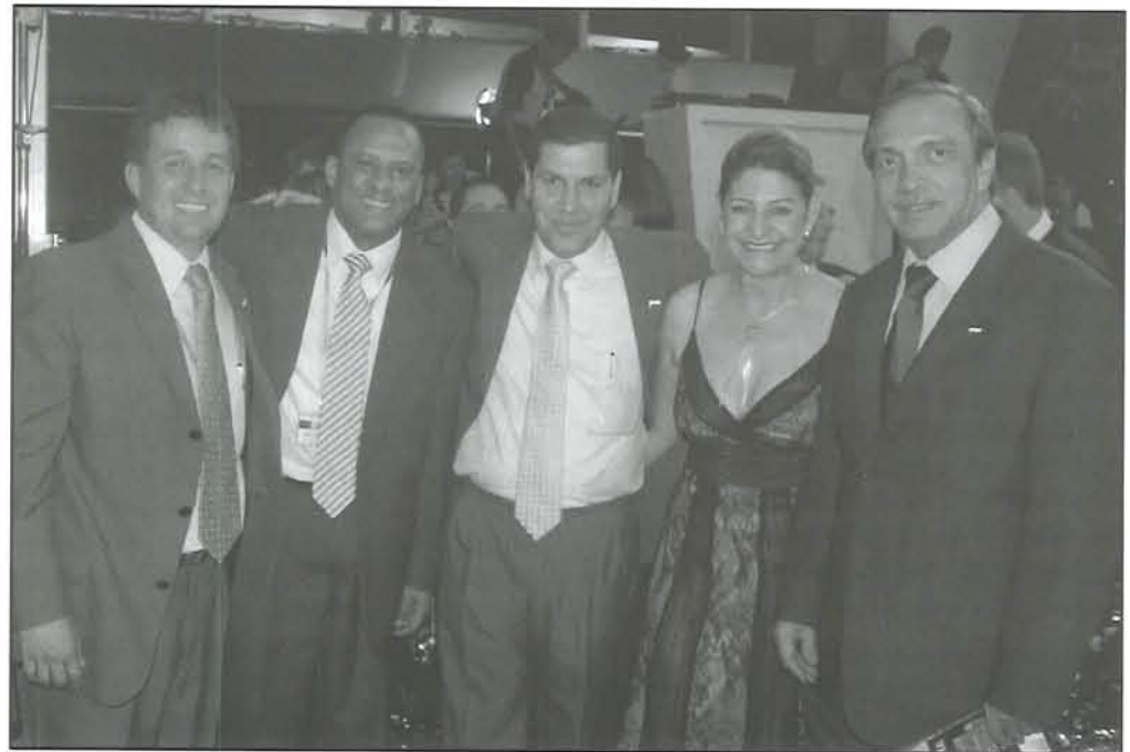
La Sexta Feria Moda para el Mundo superó las expectativas.

Y agrega que además las pasarelas contaron con modelos profesionales de Colombia y el exterior en número superior al