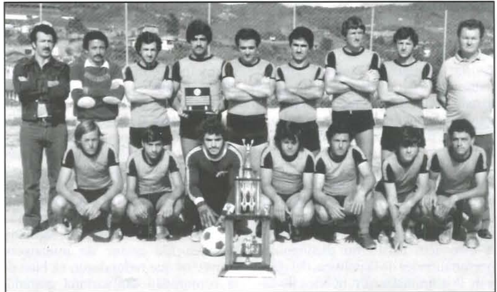
Selección santuario 1964.

Como estos dos clubes deportivos, hay otros como basquetbol, atletismo,