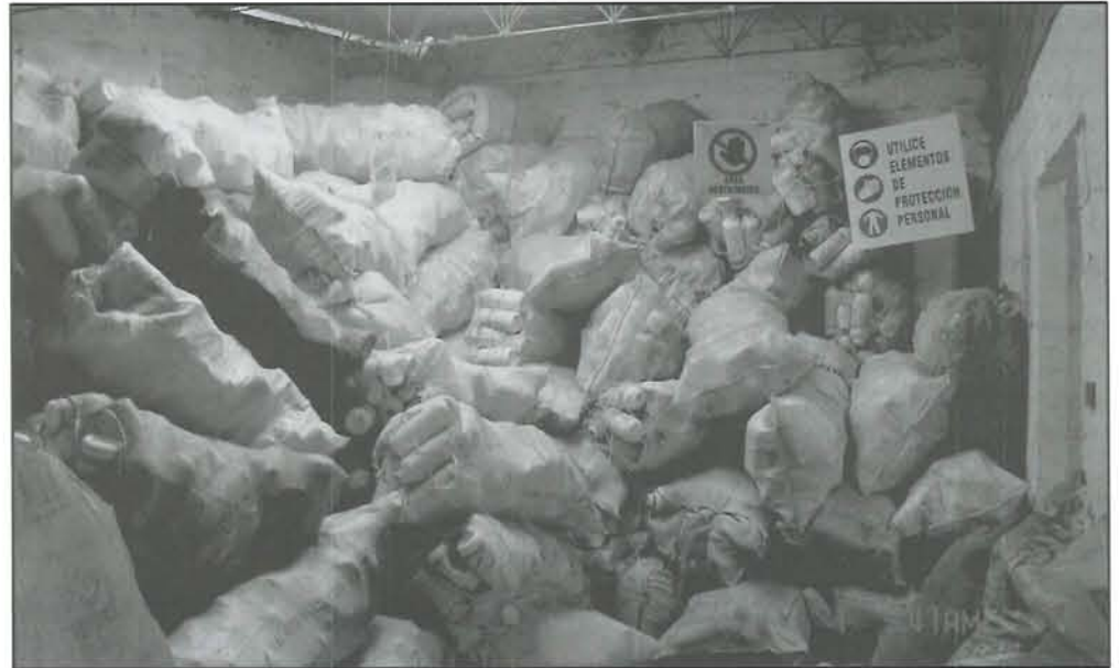
Reciclar es productivo y mejora el medio ambiente.

En este marco, uno de los programas que ha causado un impacto positivo tiene que ver con el “manejo- recolección y