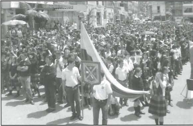
Nutrida celebración patria.