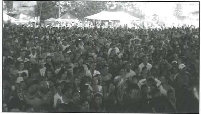
Los campesinos fueron homenajeados con música.

Un sentido homenaje brindó la administración municipal a los campesinos de nuestra localidad que de sol a sol labran la tierra para brindarnos el alimento diario. El acto se llevó a cabo el pasado 25 de julio en las instalaciones de la plaza de mercado y contó con una nutrida participación de todas las juntas de acción comunal y sus familias quienes disfrutaron del desfile artístico que se les brindó en las voces de los relicarios, y de la artista popular del momento Arelis Henao.