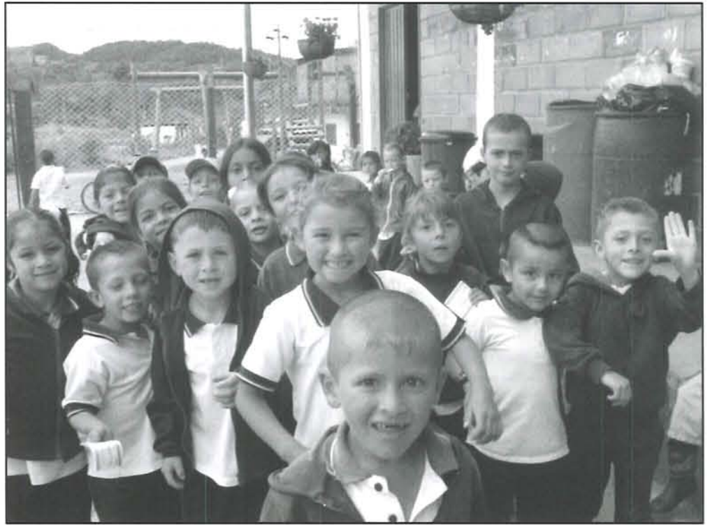
La alegría de estudiar brota de sus rostros.

En el caso de los estudiantes de los que pude conocer su historia, han