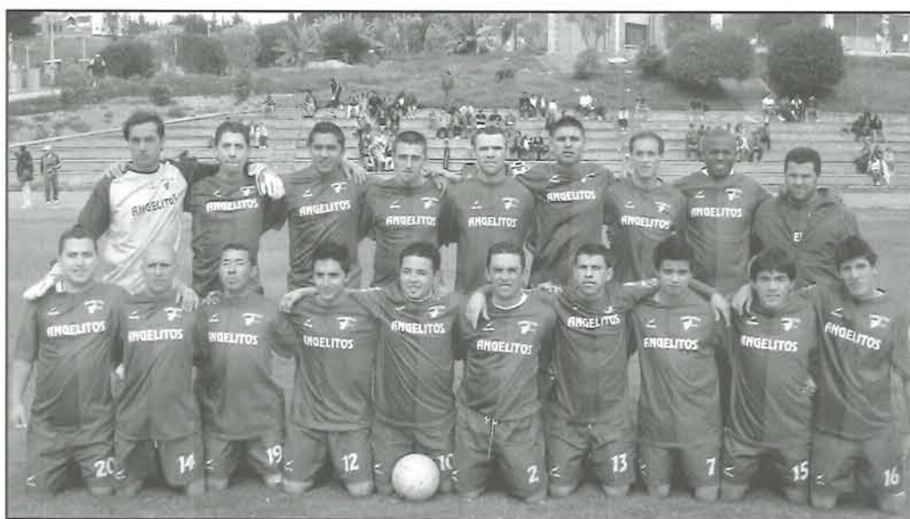
Equipo Angelitos, campeón en Tunja.