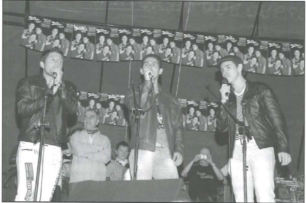
Sexto Sentido, nueva generación del talento artístico santuariano.

Mientras tanto, los carteles en las paredes del pueblo no decían otra cosa que este grupo era su orgullo y el de