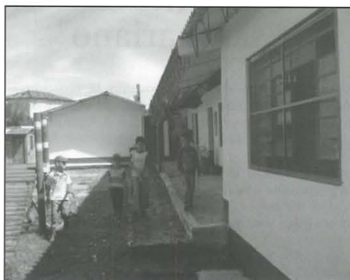
La escuela remozada.