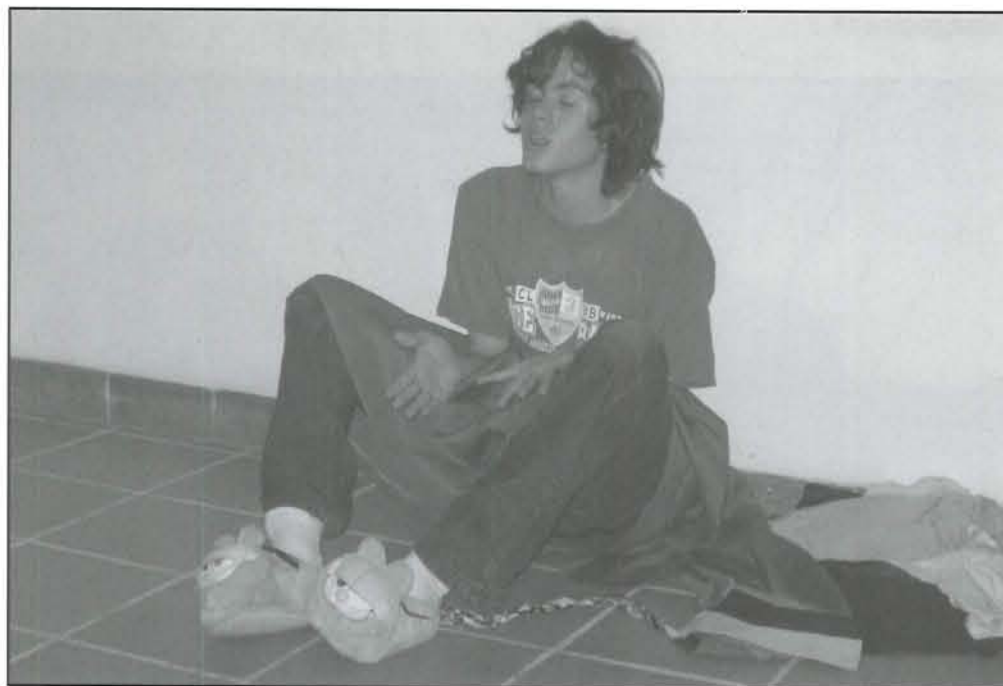
Escena de teatro y de la vida real...