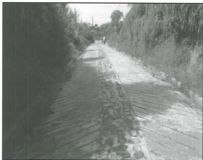
La vía enriellada.