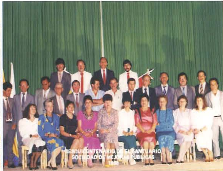
En las Fiestas Sesquicentenarias, en pleno la Sociedad de Mejoras Públicas.