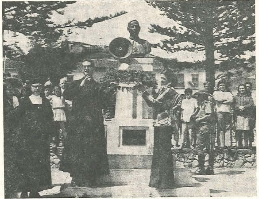
Momento de la ofrenda floral ante el monumento de Monseñor Ignacio Botero Aristizábal durante las fiestas centenarias.