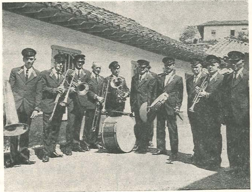
Nuestra banda compuesta por verdaderos virtuosos de la música y hombres plenos de civismo, estrenan uniforme en las fiestas centenarias del natalicio de Monseñor Botero.