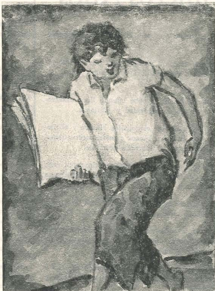
BOCEADOR DE PRENSA — Acuarela de Horacio Longas

Hay personas que por padecer simultáneamente dos enfermedades en grado sumo, no son conocidas lo suficiente dejando de brillar con los múltiples y coruscantes colores de sus extraordinarios méritos.