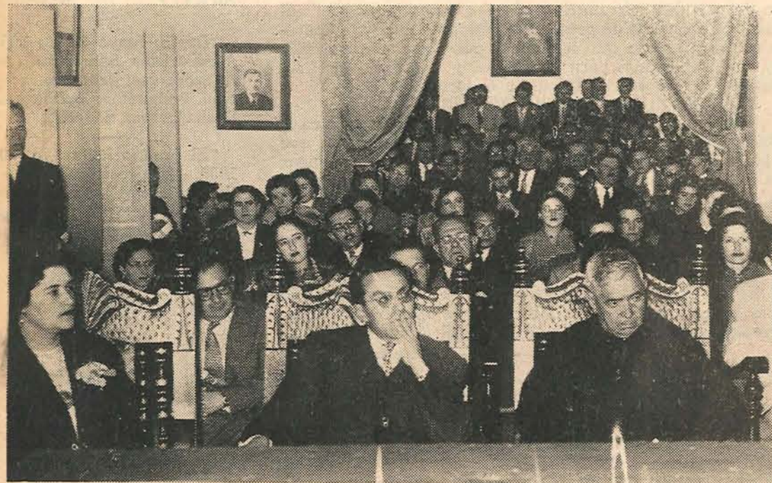
Un aspecto de la selecta concurrencia al solemne acto de inauguración de la Biblioteca "Filemón de J. Gómez" y celebración del centenario del nacimiento de Don Marco Fidel Suárez.