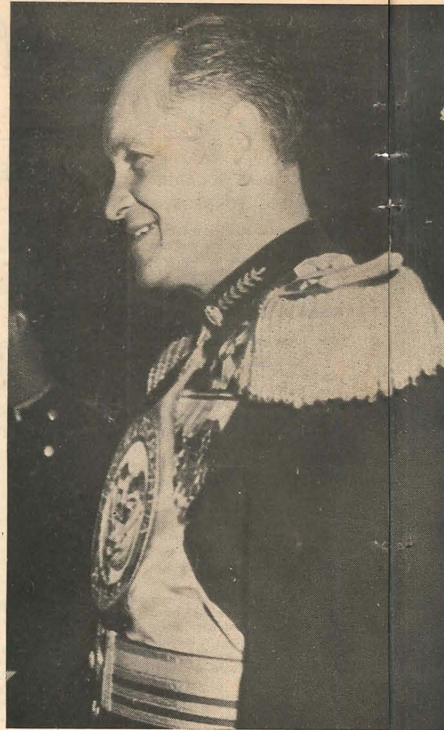
Teniente General GUSTAVO ROJAS PINILLA ...un gobierno para todos los colombianos...