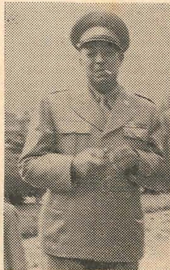
Brigadier General PIOQUINTO RENGIFO ...el más ecuánime de los gobernantes que ha tenido Antioquia...