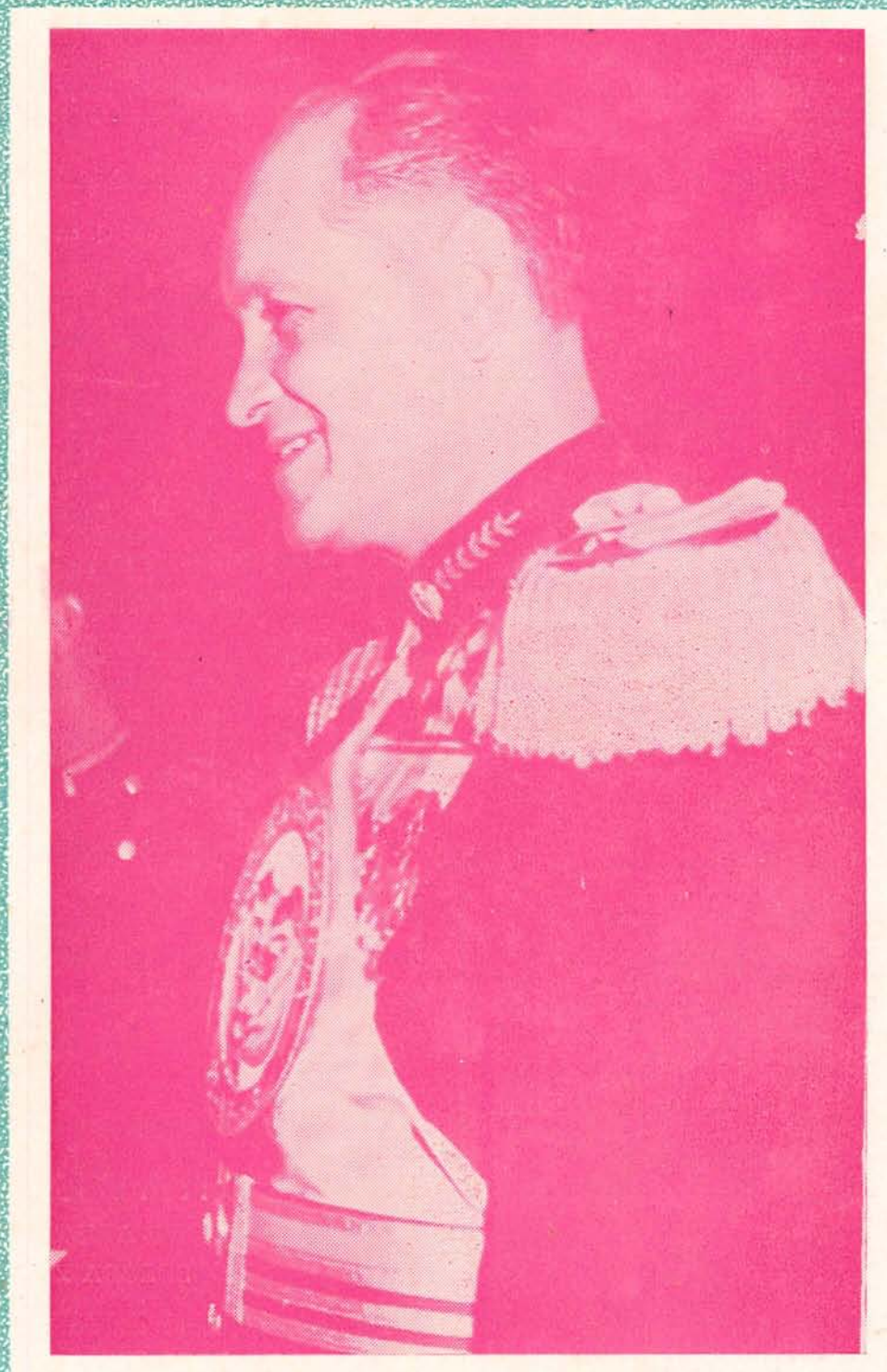
EXCELENTISIMO SEÑOR TENIENTE GENERAL GUSTAVO ROJAS PINILLA

ORGANO DE LA SOCIEDAD DE MEJORAS PUBLICAS