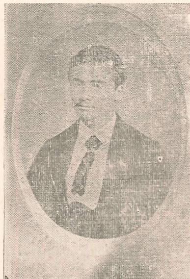
Marco Fidel Suárez

Retrato del ilustre bellino y eminentísimo cantor de Cristo, cuan-