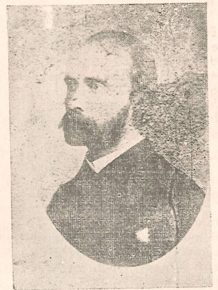
Retrato del Señor Suárez cuando estaba en la plenitud de la vida.

do aún estaba muy joven. Este clisé fue un obsequio que nos hizo el Sr Suárez cuando ocupaba la Presidencia de la República.