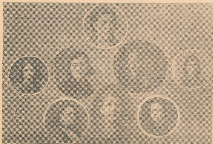
Para la Sociedad de Mejoras Públicas, su Cuadro de Honor ha sido en sus cuatrocientas sesiones una vigorosa fuerza motriz, apoyo eficaz y estímulo permanente en sus campañas cívicas y culturales.

Por esfuerzo continuado y armónico de la Sociedad de Mejoras Públicas de El Santuario, ayudado por valiosas unidades de esta misma Sociedad que residen en Bogotá, se consiguieron Personería Jurídica para la Corporación, correo diario y giros postales y telegráficos para toda la ciudadanía; las mejoras en el alcantarillado de la ciudad, la construcción del kiosco y su apoyo decisivo a toda obra cultural de cualquiera naturaleza que se inicie, es un imperativo para todos los socios.