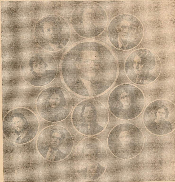
Grupo de catorce institutores de los veintiuno que sesionaron extraordinariamente el 6 de mayo con motivo del primer centenario de la muerte del Gral. Santander. En este día los maestros, aparte de la sesión solemne, desarrollaron un programa interesante y simpático.