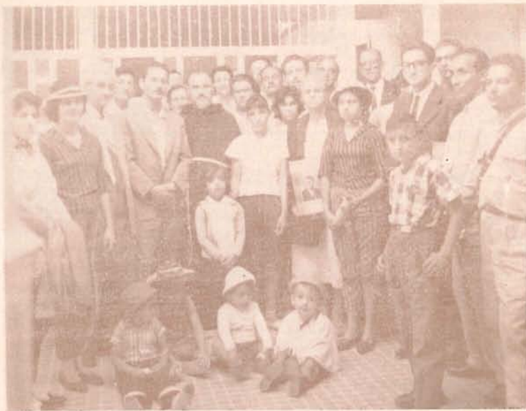
Esta foto recoge un grupo de miembros del Centro cívico "Filemón de J. Gómez", de Medellín, con motivo de su reciente paseo a El Santuario.