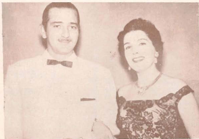
MONTECRISTO, ACOMPAÑADO DE LA REINA DEL TANGO, LIBERTAD LAMARQUE.