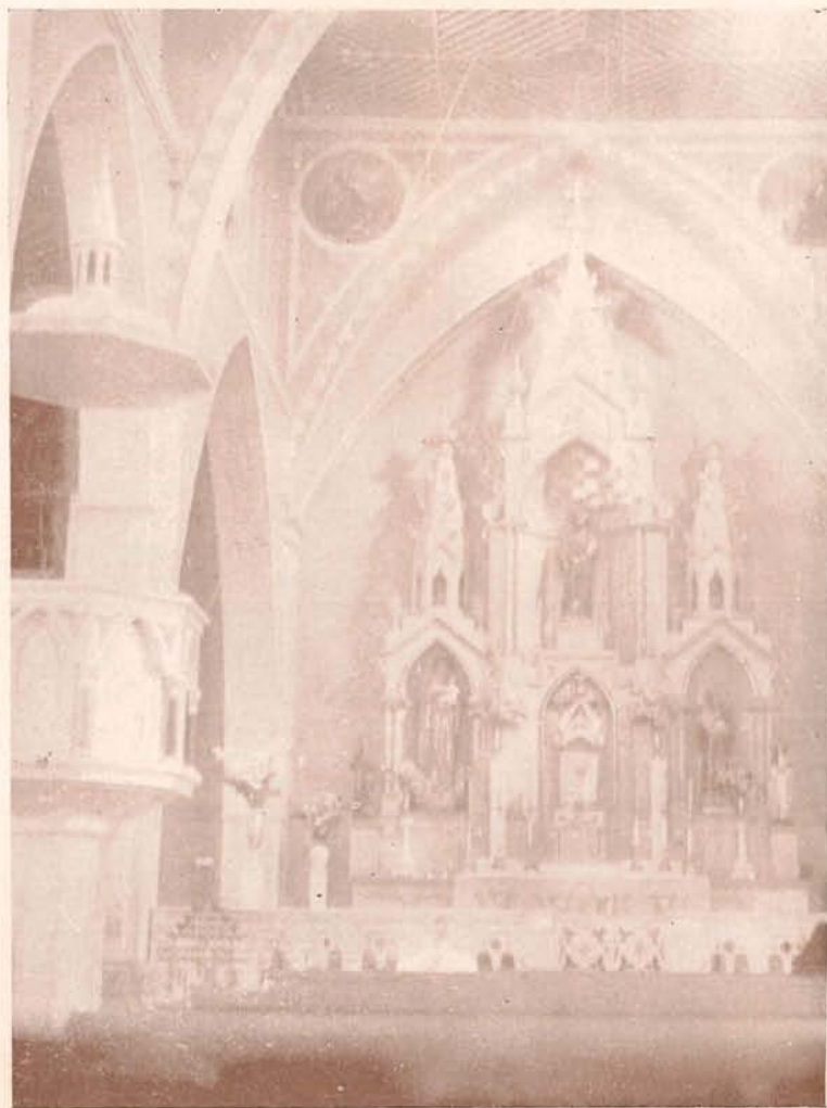
Presenta la gráfica el altar mayor del bello templo de San Judas Tadeo, convertido desde hace muchos años en santuario, donde dan los fieles los agradecimientos al glorioso taumaturgo por los prodigiosos milagros concedidos a todos los fieles.