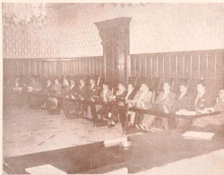
Grupo de la Colonia Santuariana en Bogotá, durante una de las sesiones ordinarias realizadas en esa ciudad capital.