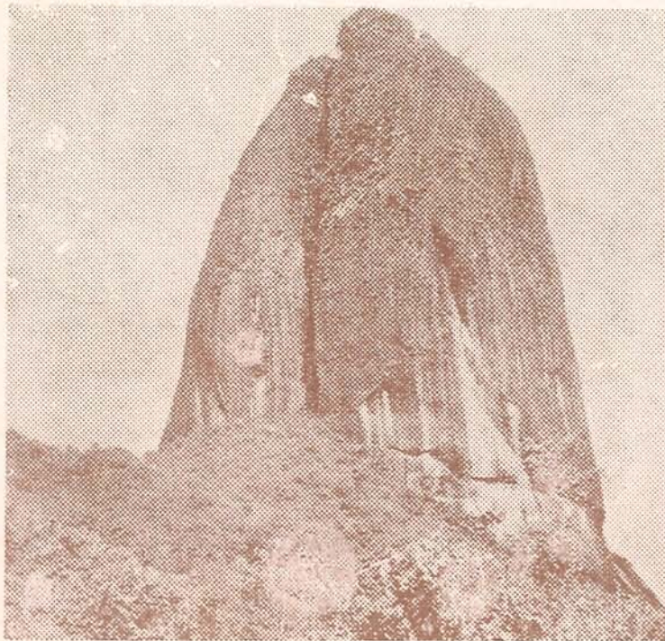
La Piedra del Peñol, un lugar de atracción turística.