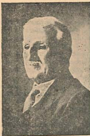
Don José M a Zuluaga