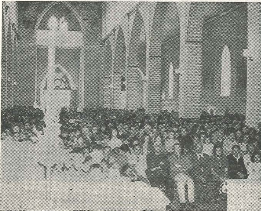
Asistentes a la inauguración de la nueva Parroquia de San Judas Tadeo