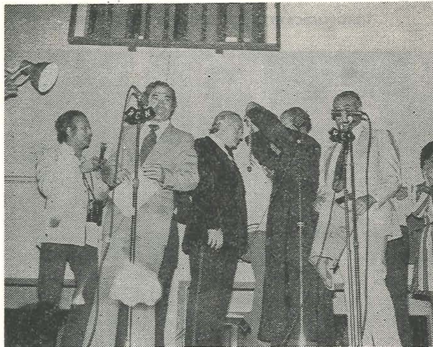
Un aspecto del homenaje ofrecido a MONTECRISTO

Para cerrar con broche de oro este significativo homenaje, en los sa-