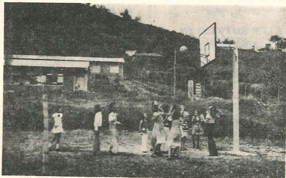
Aspecto exterior del Hogar Juvenil Campesino y sus instalaciones deportivas.