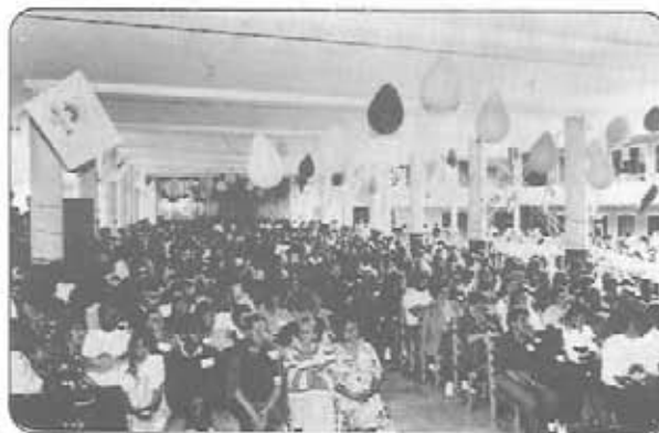
Aspecto general de la multitudinaria asistencia a la Ultreya Navideña

Cada delegación fue presentando un informe sobre las actividades realizadas en 1991 y los proyectos que se tienen para 1992.