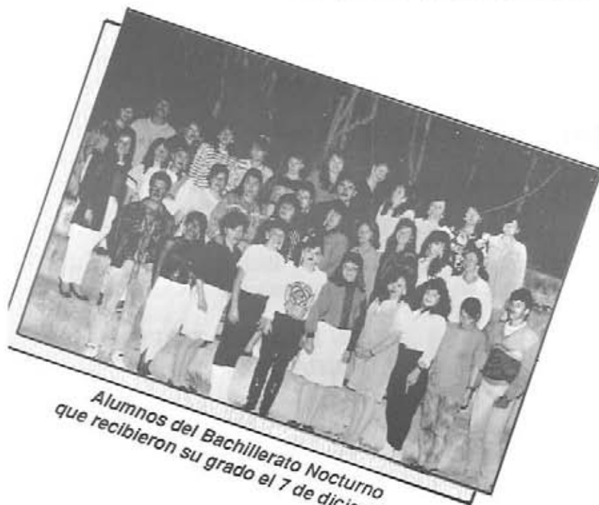
Alumnos del Bachillerato Nocturno que recibieron su grado el 7 de diciembre.