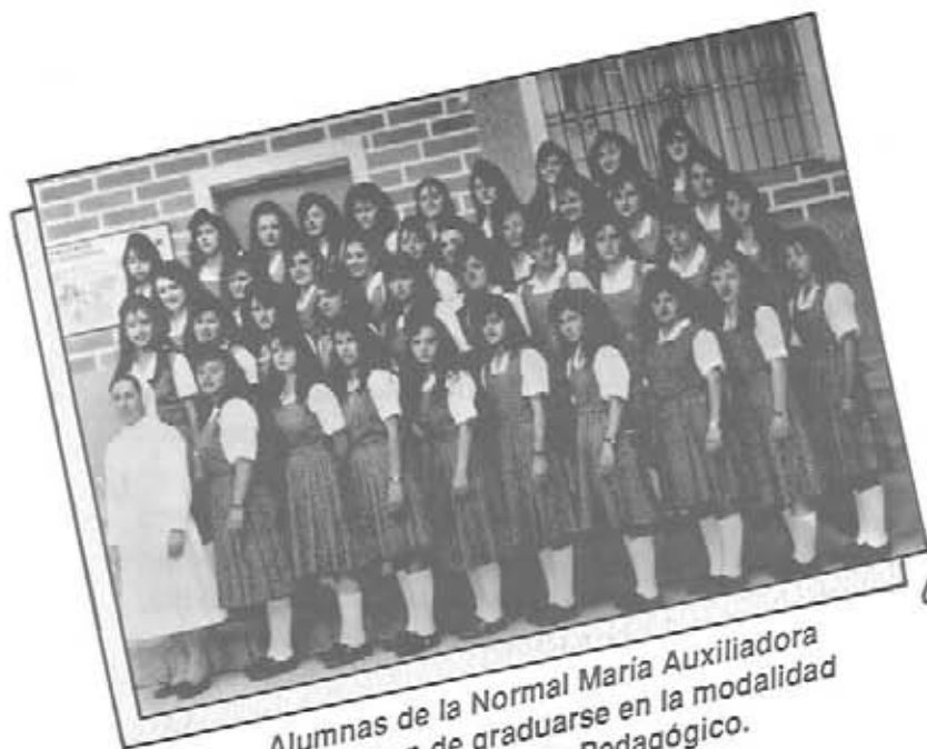
Alumnas de la Normal María Auxiliadora que acaban de graduarse en la modalidad de Bachillerato Pedagógico.