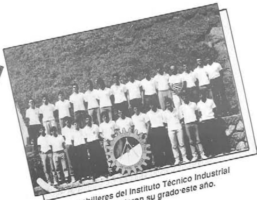
Bachilleres del Instituto Técnico Industrial que recibieron su grado este año.