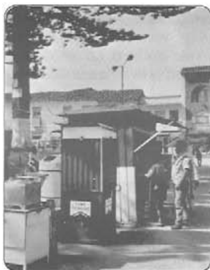
Casetas ancladas en el piso de la plaza de El Santuario

1º. EL SANTUARIANO denuncia, con profunda tristeza y con justa indignación, el abuso de algunos activistas políticos que en la pasada campaña electoral tuvieron el descaro y cometieron la grosería de manchar los monumentos de los próceres que están situados en las esquinas del parque, con calcomanías de algunos candidatos a la gobernación, por cierto de los perdedores. Está bien que se haga propaganda política, pero respetando lo que es digno de respeto.