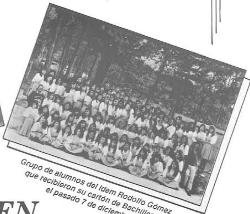
Grupo de alumnos del Idem Rodolfo Gómez que recibieron su cartón de Bachilleres el pasado 7 de diciembre.