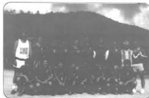
Once Agiles. Campeón de primera categoría 1991

Luego de muchos años de retiro, regresó a participar en primera, uno de los equipos de más tradición en el fútbol santuariano, como quiera que ha sido campeón varias veces. Este año reapareció en forma brillante se llevó los honores al quedar campeón. Talleres Unidos se llevó el subtítulo y también cumplió un acertado papel al lado de Peñarol y Los Botero.