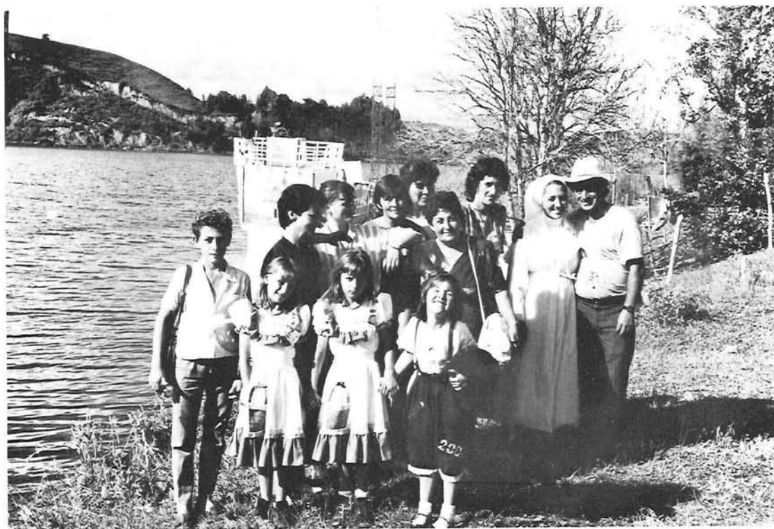
ALGUNOS DE LOS INTEGRANTES DEL GRUPO "PASTORAL DE SALUD"