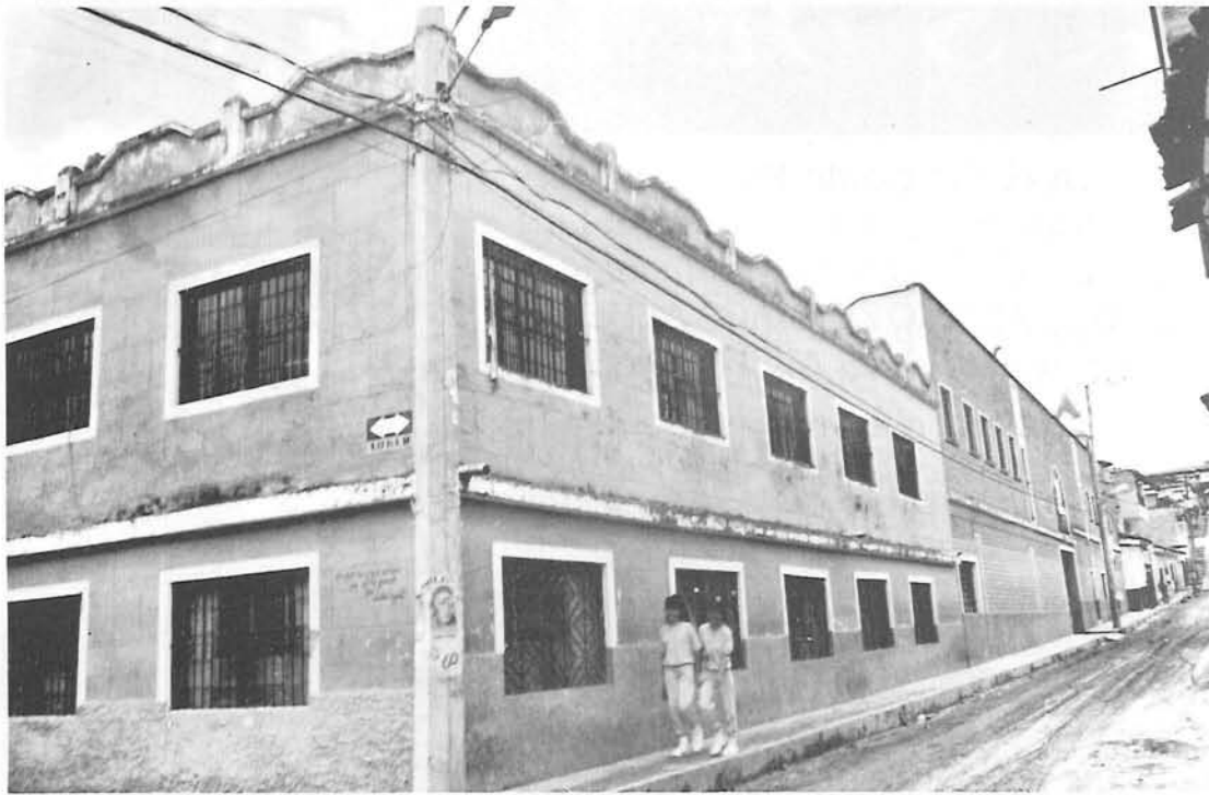
Aspecto exterior de la Normal María Auxiliadora de El Santuario, dirigida por las Reverendas Hermanas Salesianas, quienes cumplen magnífica labor docente.

"Es muy posible que el acontecimiento más importante para este municipio en el presente siglo haya sido la llegada, en 1922, de la Comunidad Salesiana para dedicarse a la formación de la juventud femenina. Los hogares santuarianos han conservado las buenas costumbres, las mujeres de El Santuario siguen siendo recatadas y devotas fervientes de María Auxiliadora, porque las Hermanas Salesianas han sabido inculcar en sus alumnas, desde niñas, esas bellas virtudes que son el más primoroso adorno del jardín femenino de El Santuario".