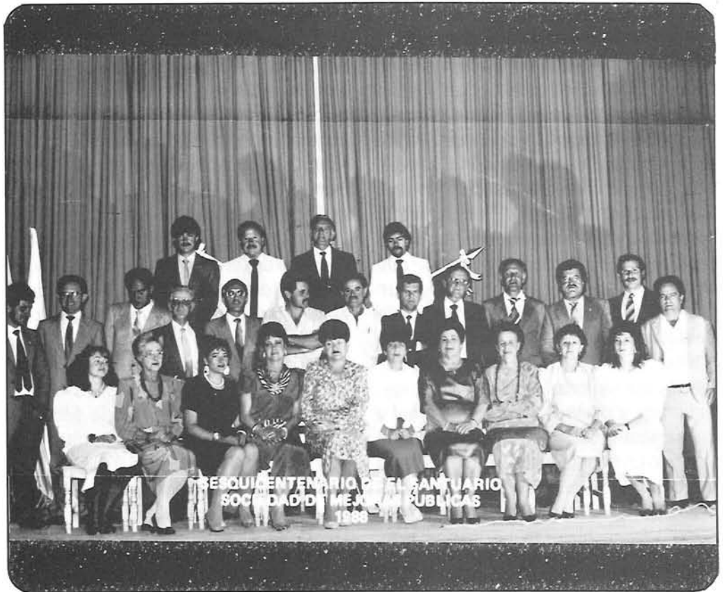
Integrantes de la Sociedad de Mejoras Públicas de 1989 y 1990