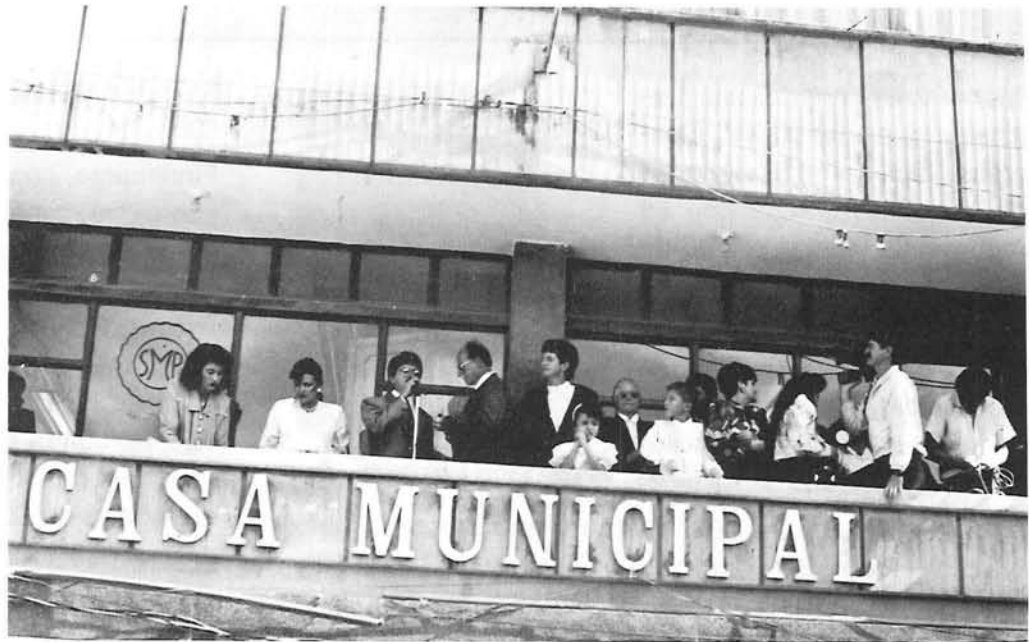
Acto en el cual tomó posesión el nuevo alcalde de El Santuario.

P. ¿Cómo encuentra el municipio; su infraestructura, su estructura administrativa, su presupuesto, en fin su estado real?