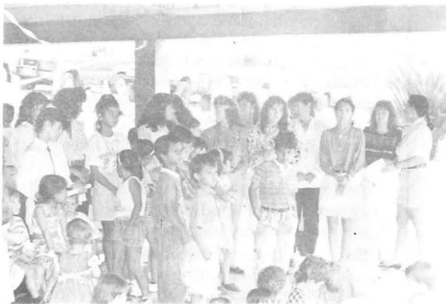
Vista parcial de las asistentes al encuentro de Exalumnas Salesianas, realizado en la ciudad de Cali el pasado 30 de mayo.