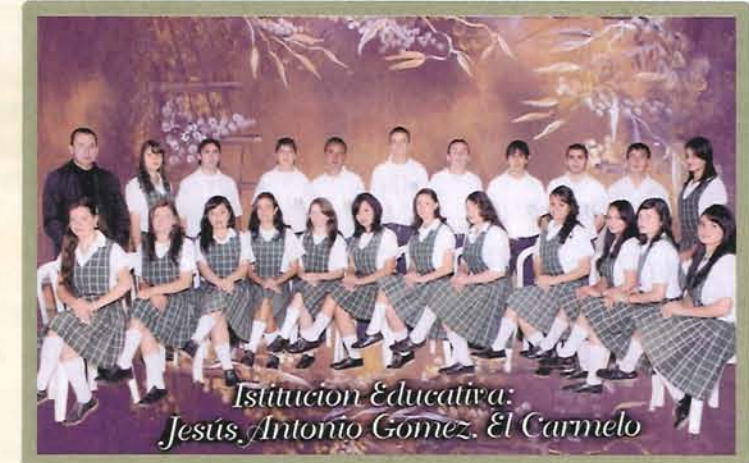
Institucion Educativa: Jesús Antonio Gómez, El Carmelo