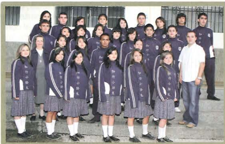
Colegio María Auxiliadora