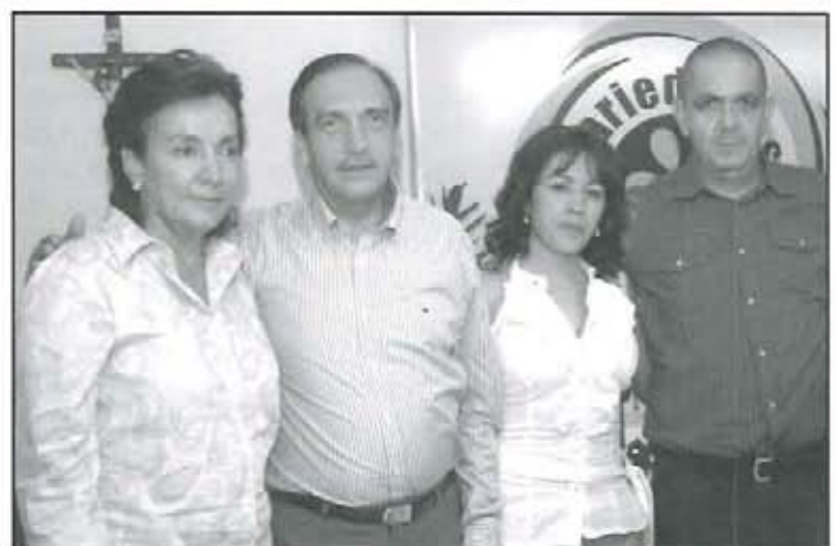
El Gobernador de Antioquia Luis Alfredo Ramos acompañó la celebración de los 30 años de Caroleste.

Felicitaciones a Caroleste en sus 30 años, y que perdure en el campo de las grandes empresas.