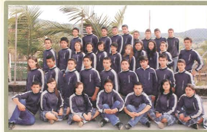
I.E. Jose María Córdova 11B