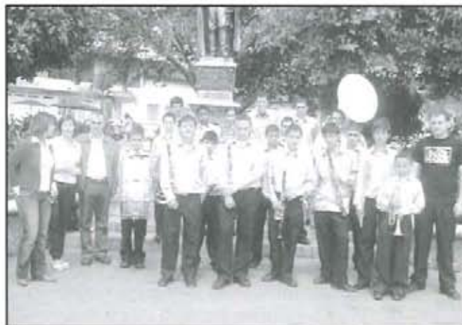
Banda de música juvenil Casa de la Cultura participante en el festival.

Se espera que con estos encuentros que desde hace 3 años se vienen realizando en las subregiones de Antioquia, se fortalezca los procesos culturales de cada uno de los municipios y se mejoren cada una de las escuelas de formación artística que en los municipios se han venido posicionando y que responden al Plan Departamental de Cultura 2006-2020.