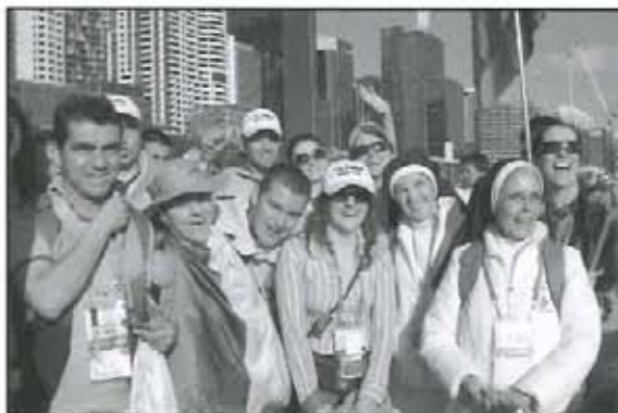
Grupo de santuarianos que viajaron a Sydney, Australia.