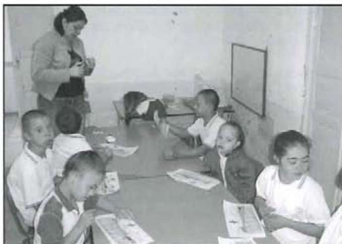
Los niños son el centro de atención en Alifisán.

Queremos tener un espacio digno donde podamos desarrollar todas nuestras actividades y