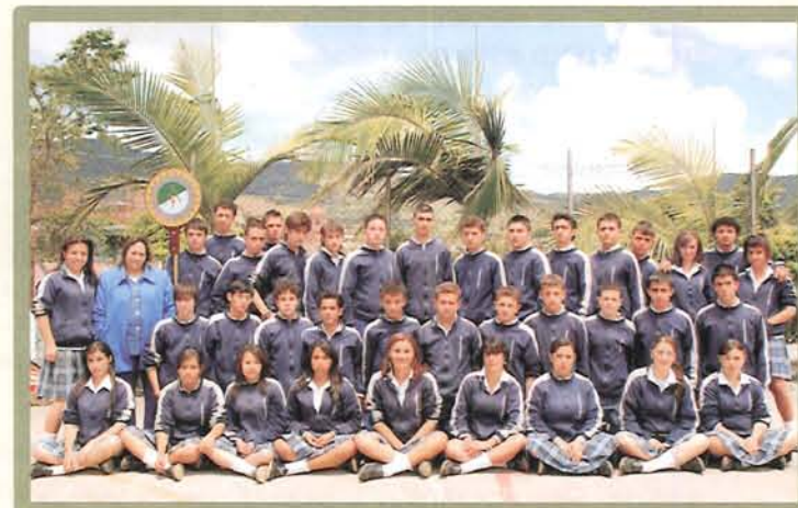
I.E. Jose María Córdova 11A