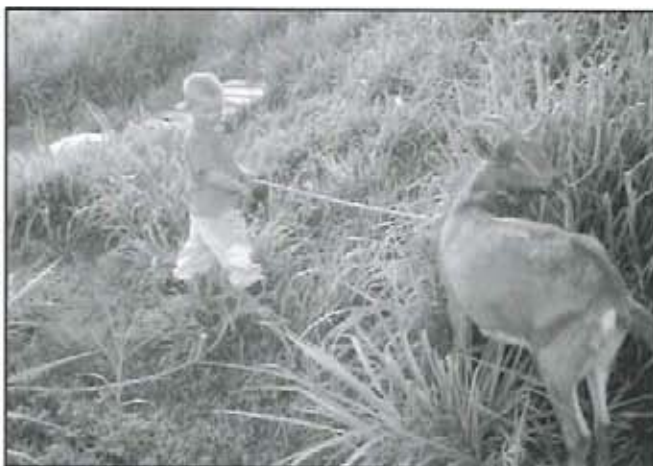
La capricultura crece en nuestro municipio.

80 personas capacitadas en capricultura en el primer seminario caprino.