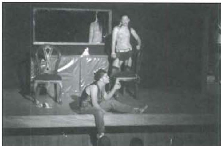
Grupo Genesis Teatro de El Santuario.

La Administración Municipio El Santuario Obra de todos, por medio de la Secretaría de Educación y la Casa de la Cultura Luis Norberto Gómez, con el empeño de ofrecer espacios de sano esparcimiento para niños, niñas, jóvenes, adultos y familia, realizó el V Festival Nacional de Teatro, con la participación de grupos nacionales y el grupo internacional de Argentina, quienes durante una semana, disfrutamos tanto chicos como grandes, de las obras escénicas que se presentaron entre el 23 y el 29 de agosto del año que transcurre.