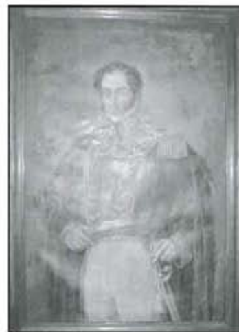
Óleo de Simón Bolívar.

El hecho sucedió en el transcurso del descanso del medio día de ese 23 de julio, cuando ladrones violentaron una de las ventanas de la oficina del Coordinador Cul-