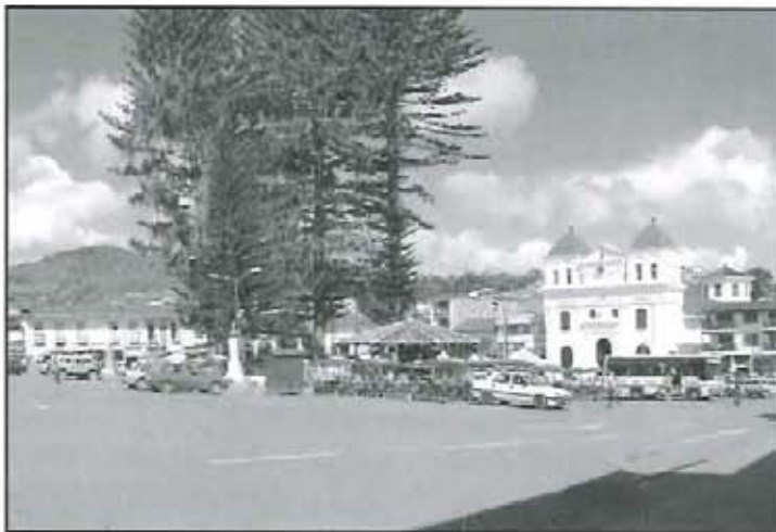
Plaza Mayor José María Córdova.

Llegó el momento en que los vecinos de El Santuario se consideraron mayores y con derecho a dirigir sus propios asuntos municipales, desde el año de 1813 cuando habitaban en su territorio 1.127 personas, iniciaron los trámites para lograr su independencia de Marinilla, después de varios intentos y de la revo-