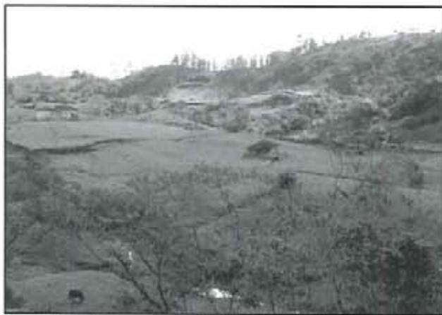
La agricultura es una de las principales actividades.

La construcción de la escuela es antiquísima y es de las escuelas más antiguas del municipio. "En el año de 1919 cuando yo cursaba el primero de prima-