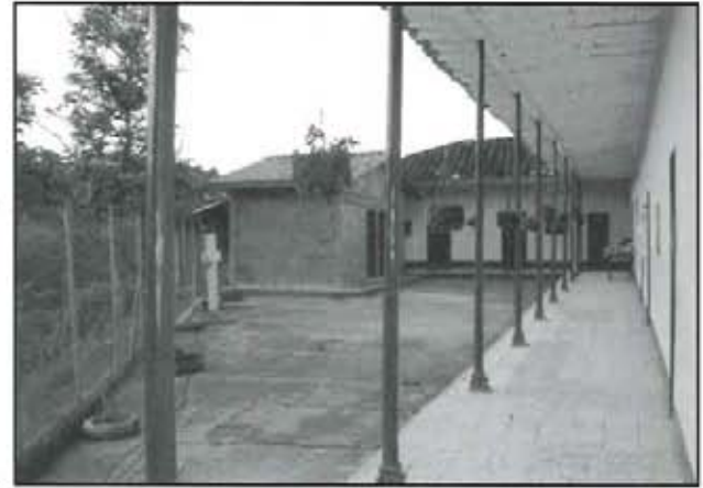
Alrededor de la Escuela giran las actividades comunitarias de sus moradores.

En 1980 por gestión de la Junta de Acción Comunal y la intercesión del Doctor Orestes Zuluaga Salazar se logra la instalación eléctrica para la escuela y 30 viviendas. Los vecinos financiaron sus propias conexiones con préstamos personales otorgados por la Caja Agraria.