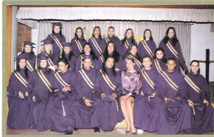
Concep siglo XXI