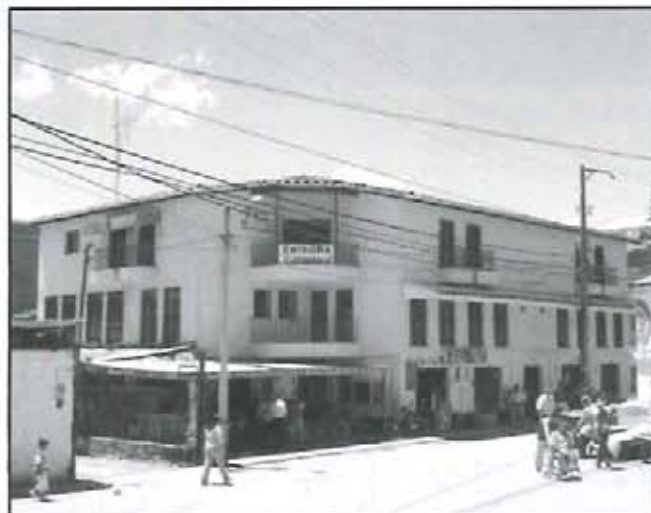
Proyección social del Club Rotario.

Para proyección comunitaria. Se continuará con la ejecución de los siguientes programas: