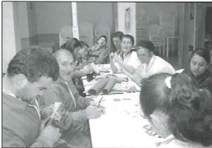
La capacitación abre horizontes.

Alifisan Institución reconocida por su gran labor y deseo de seguir apoyando esta parte de la sociedad que ha sido in visibilizada vulnerada en sus derechos. Lucha incansablemente, para desesquemmatizar este rotulo fortaleciendo en la diferencia el ser humano integro y capaz de lograr grandes cosas para su vida, la de su familia y la de la sociedad