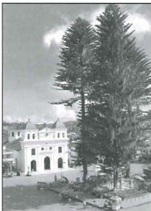
Templo de Nuestra Señora de Chiquinquirá.

Nuestro municipio conmemoró el pasado 26 de noviembre los ciento setenta años de haber sido erigido como municipio y parroquia, acontecimiento este que no puede pasar inadvertido para ningún santuariano que quiere y ama a su patria chica.