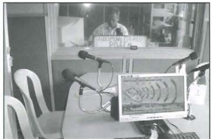
Estudio de Asocomunal Stéreo.