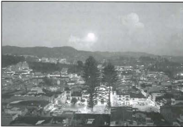
La Iglesia ha sido motor del desarrollo espiritual y material.

Es de anotar que la parroquia fue mecenas de la cultura musical en nuestro municipio pues desde el curato del padre Isaías Aristizábal se trajo el primer armonio para solemnizar los oficios religiosos y siempre patrocinaron para las festividades religiosas el coro y la