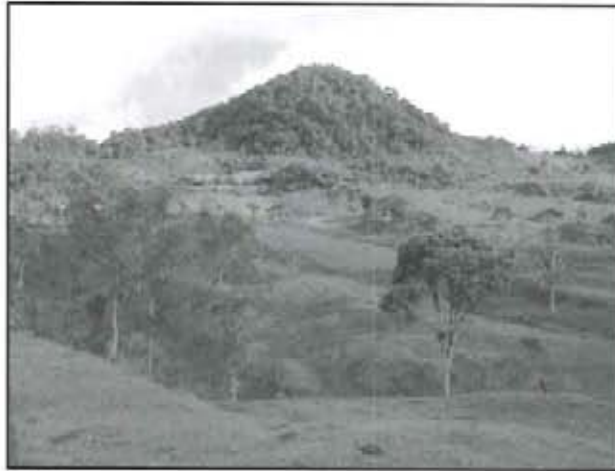
El Morro es una joya del medio ambiente santuariano.

Generalidades. El Morro es una bella vereda que se ubica al sur del municipio, a penas a 3.5 kilómetros de la zona urbana, rodeada de colinas y montañas e imponente en su cabecera el hermoso "Alto del Morro" que adorna su paisa-