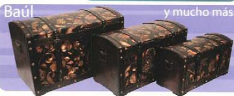
y mucho más...

Somos importadores y fabricantes de insumos para Joyería, Confección y Decoración. Ventas al por Mayor.