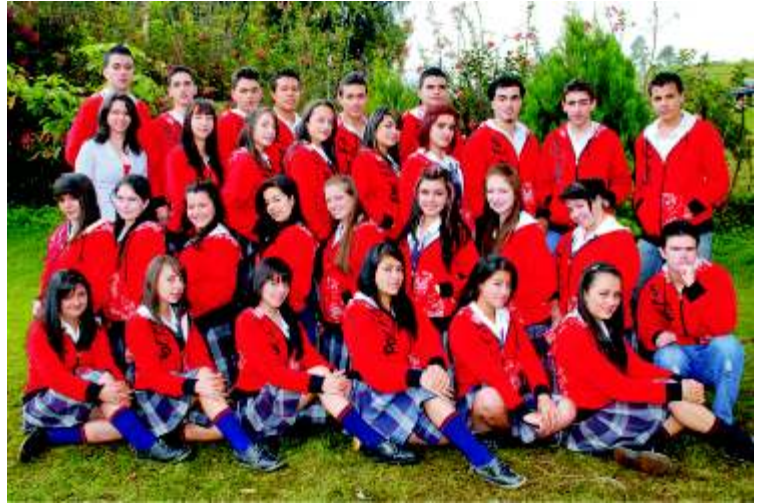
Institución Educativa Luis Rodolfo Gómez