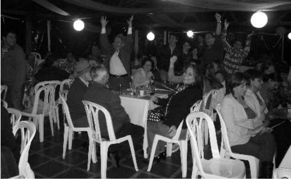
Animada reunión de socios.

Con la asistencia de la mayoría de los Socios, el pasado 20 de noviembre, en las Instalaciones del Club, se celebra con los 23 años de fundación de la Corporación. El Acto fue orientado por la Junta