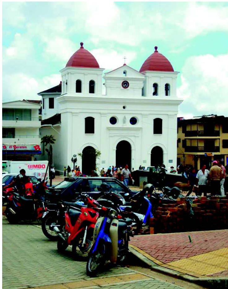
Parqueaderos para los turistas y visitantes.