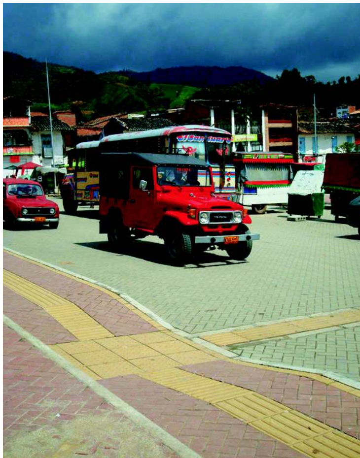
Amplias vías para un tráfico fluido, sin estacionamientos.