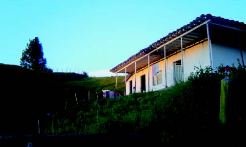
Una de las veredas más cercanas al sector urbano. Casa de campo.

Paraje rural, de belleza peculiar, donde se asienta gente sencilla, noble, honrada y trabajadora, con gran devoción a María Auxiliadora, bañado por las aguas de pequeñísimas fuentes, enriquecido con tierras fértiles y generosas; de entorno dividido por la autopista Medellín Bogotá; con fincas de recreo, pero con predominio de las hermosas y típicas viviendas, adornadas con parcelas multicolores por la variedad de sus cultivos; se trata de la vereda El Salaito.