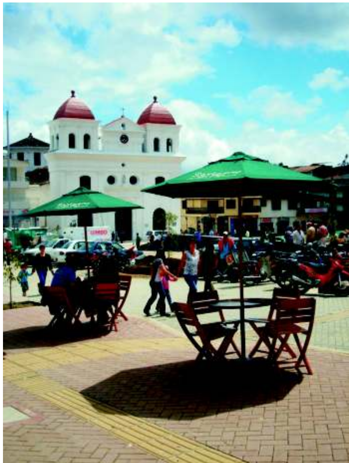
Mesas y asientos con parasol, para el descanso.

La remodelación de la Plaza Mayor José María Córdova ha sufrido una de las grandes transformaciones que ha