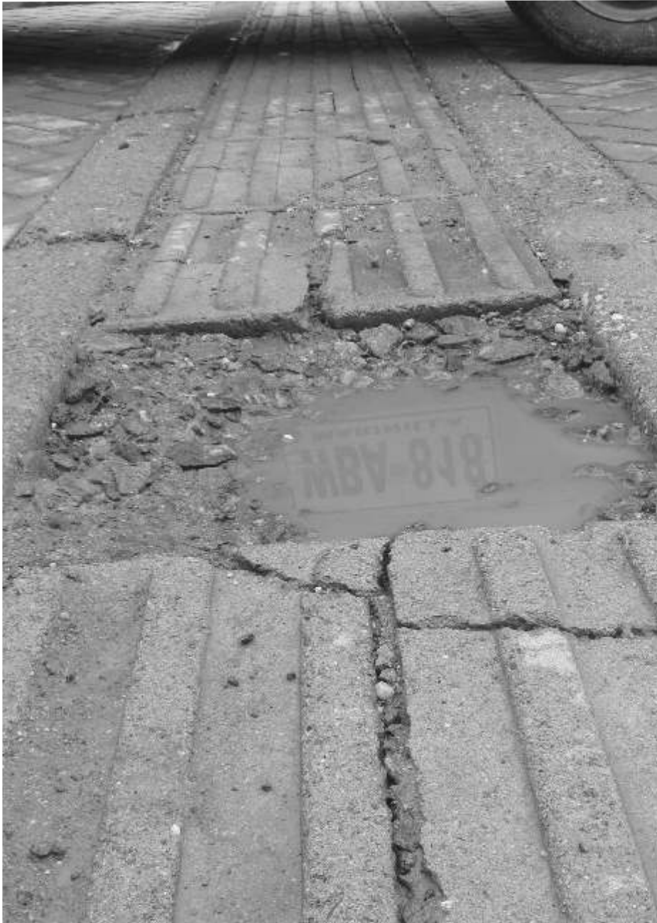
Cuidar la plaza es deber de todos.

Ver cómo va quedando la Plaza Mayor José María Córdova es gratificante y más ahora, cuando se van dando las últimas estocadas a la construcción. Sin embargo, hay un aspecto un tanto descuidado, y ni siquiera se trata tanto de la obra como de los peatones.