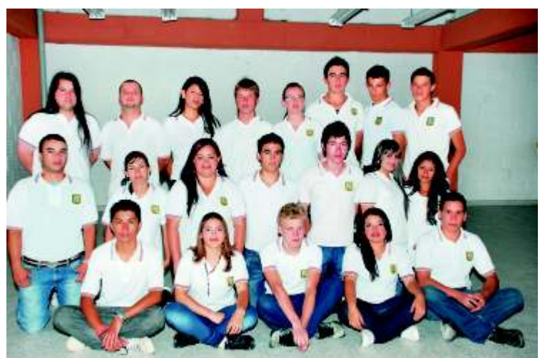
Institución Educativa Luis Rodolfo Gómez