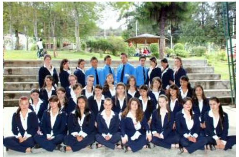
Institución Educativa Luis Rodolfo Gómez