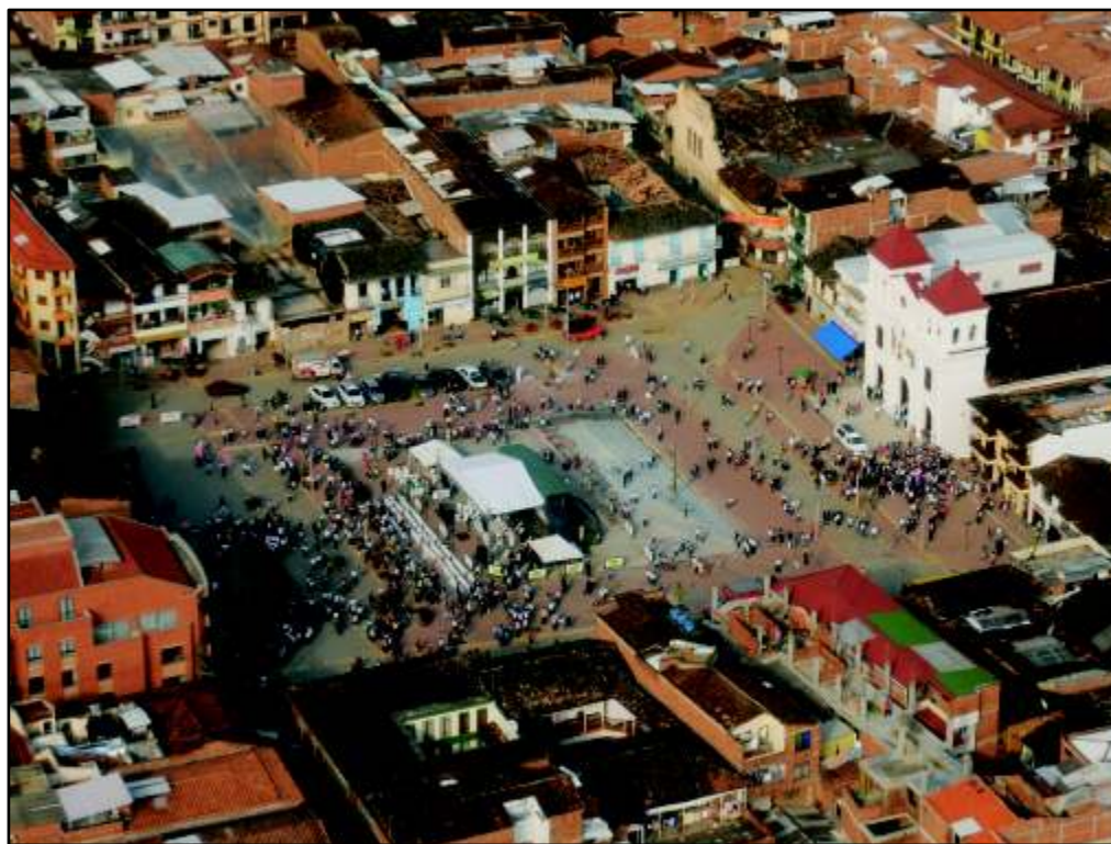
Vista aérea de la remodelada Plaza Mayor José María Córdova.

Con puntualidad inglesa, a las cuatro en punto, se iniciaron los actos de inauguración de la remodelación de la Plaza Mayor José María Córdova, aunque aún faltan los últimos retoques.