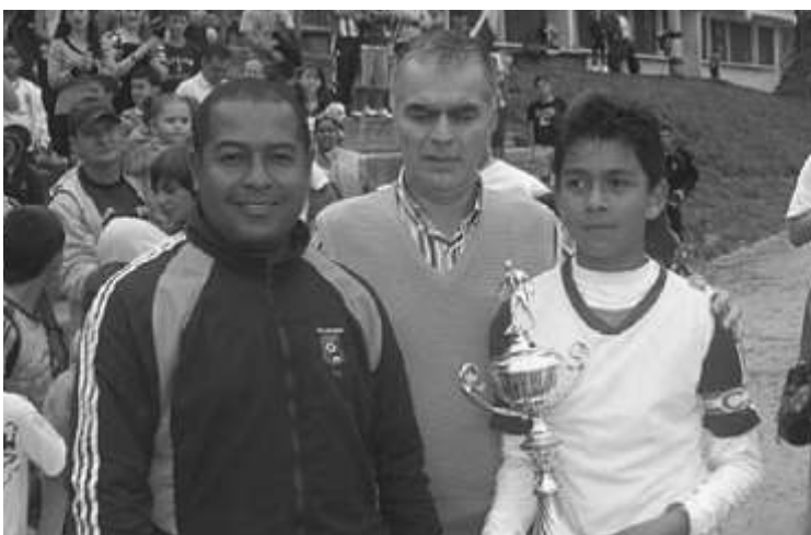
aspecto de la premiación en festival de escuelas de fútbol organizado por alianza santuariana

En el mes de octubre, el club de fútbol Alianza santuariana realizó un importante evento de nivel nacional, pues asistieron 25 escuelas de fútbol de diferentes departamentos y cuatro colonias representativas de Bogotá, Cali, Cúcuta y Medellín.