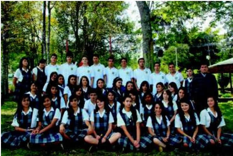
Institución Educativa Luis Rodolfo Gómez