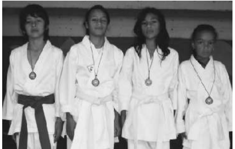
Karatecas del club Tanaka que consiguen medallas en torneos nacionales

Este deporte oriental, considerado como arte marcial, ha venido ocupando lugar de importancia entre las disciplinas deportivas que se practican en nuestro municipio, y ha cautivado a chicos y adultos que entrenan permanentemente en el polideportivo.