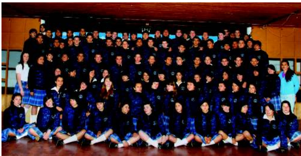
Institución Educativa José María Córdova

Nuestros procesos garantizan un excelente resultado en sus productos