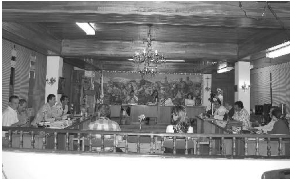
Salón de sesiones del Concejo.