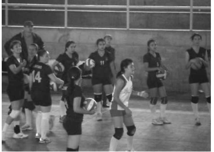
Equipo de voleibol femenino subcampeón en zonal de oriente de Juegos Departamentales

Los procesos que se vienen recuperando con el trabajo organizado con los semilleros, han mostrado sus resultados con la buena participación en diferentes torneos, como el caso del voleibol femenino que ha venido disputando finales en las participaciones donde han intervenido.