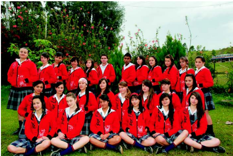
Institución Educativa Luis Rodolfo Gómez