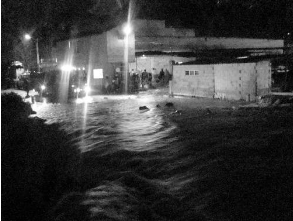
El local del Cuerpo de Bomberos Voluntarios se inundó y cayó un muro.

Al igual que todo el país, El Santuario ha tenido que padecer los daños generados por el invierno, que hasta ahora van ganando cifras y que los organismos de socorro buscan, a toda fuerza, combatir y por supuesto, prevenir.