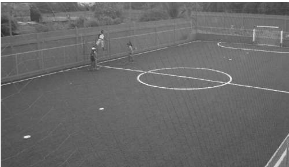
Pronto terminará la instalación de la cancha sintética.

La Corporación Club El Santuario, en su afán de generar espacios de recreación y sano esparcimiento para los santuarianos, inició el proyecto de construcción de una cancha sintética en las instalaciones del club.