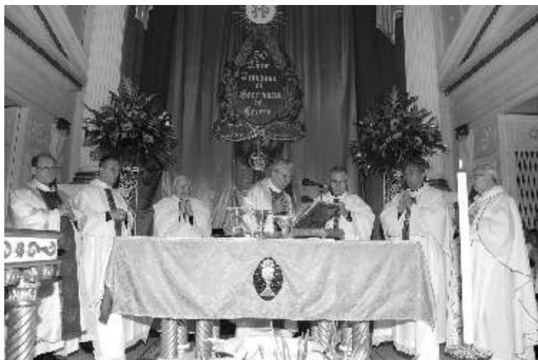
La ceremonia religiosa tuvo lugar en el templo de Nuestra Señora de Chiquinquirá.