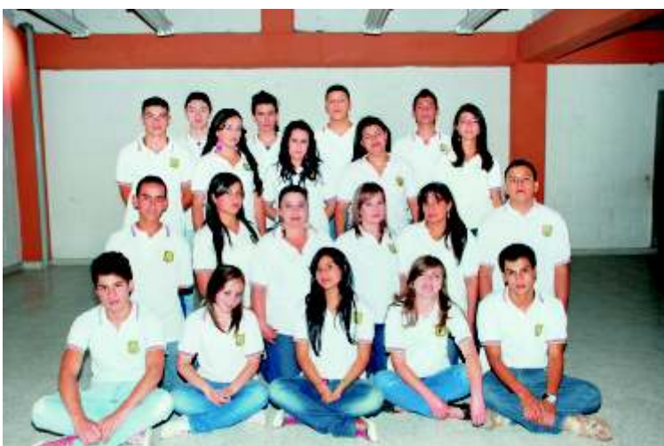
Institución Educativa Luis Rodolfo Gómez