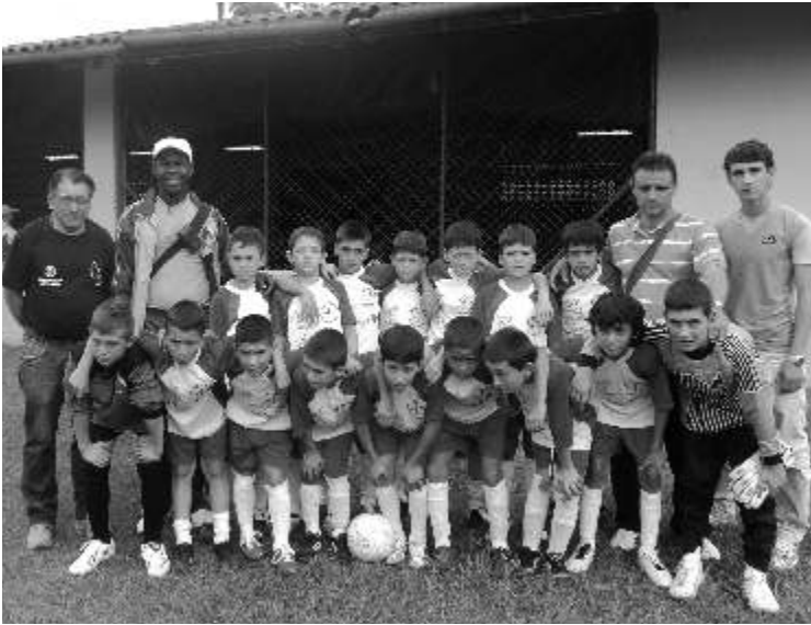
Campeón Departamental en Urrao.

Club Delsa, club de El Santuario, cumple 25 años en el municipio, como escuela de fútbol interesada en la formación integral del niño y el adolescente.