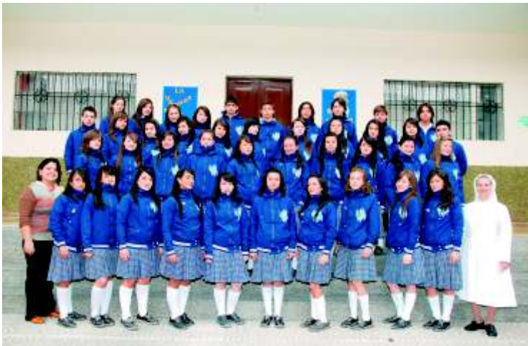
Colegio María Auxiliadora