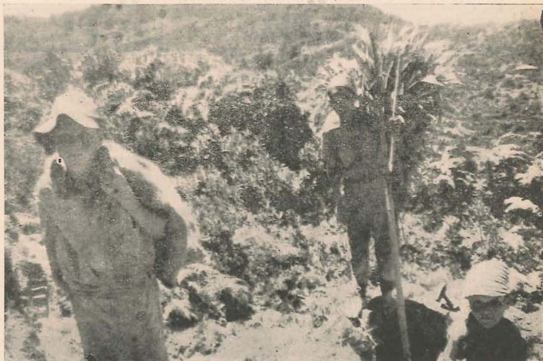
...Salen diariamente a trabajar Cara al Sol.

Hablar de posibilidades en las condiciones en que se encuentran actualmente no solo Aldana y El Santuario sino todo el Oriente Antioqueño, es utópico. La esterilidad de las tierras, una agricultura únicamente empírica —no mecanizada—, la no industrialización, el abandono administrativo, las estructuras sociales y mentales mantenidas desde siempre, no dejan ver un porvenir muy claro.