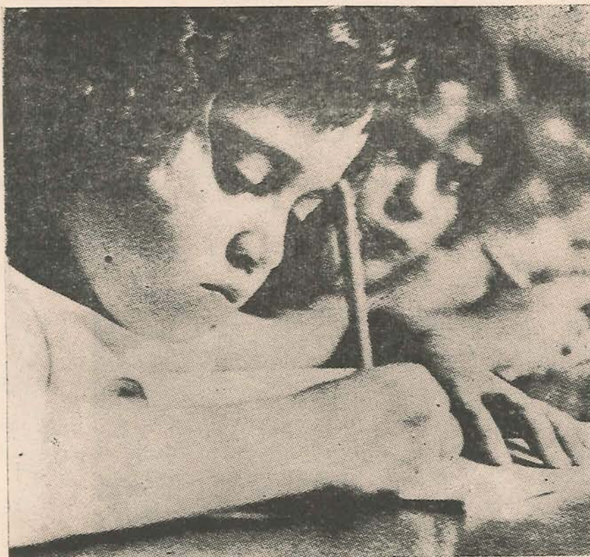
Niños ansiosos de EDUCACION y de sus beneficios

Uno de los nuevos planes de EL SANTUARIANO, es el de llevar en cada número la imagen actual de una de los pedazos del terruño. Muchos de los santuarianos ausentes, seguramente sentirán emoción al ver cual es la realidad de aquel pedazo de tierra que los vió nacer, y del cual talvez hacía mucho tiempo no tenían una imagen.