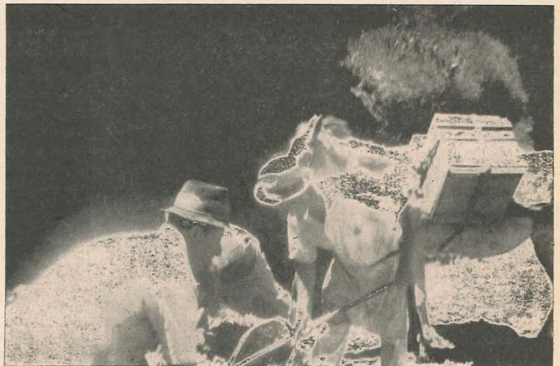
Hombres de todas las edades se entregan a duras faenas.

Hablar de las formas de vida, de los niveles alcanzados, de las NECESIDADES de Aldana, es repetir lo que oímos a diario del campo colombia-