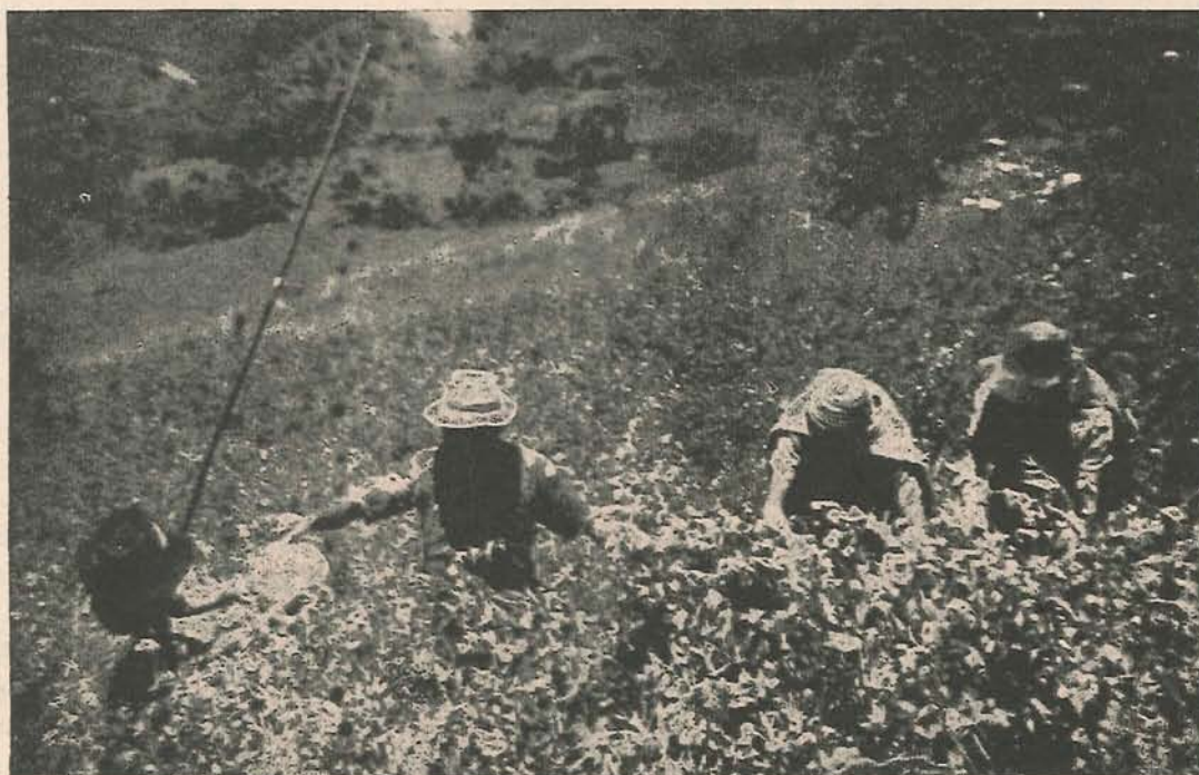
Campeños de Aldana dedicados a sus labores cotidianas.

Con esta organización, han logrado mediante el propio esfuerzo y un mínimo de ayuda externa las contadas comodidades reales que tiene la vereda: Escuela, carreteras, agua corriente, etc., y en general el mejoramiento del bajo nivel de vida.