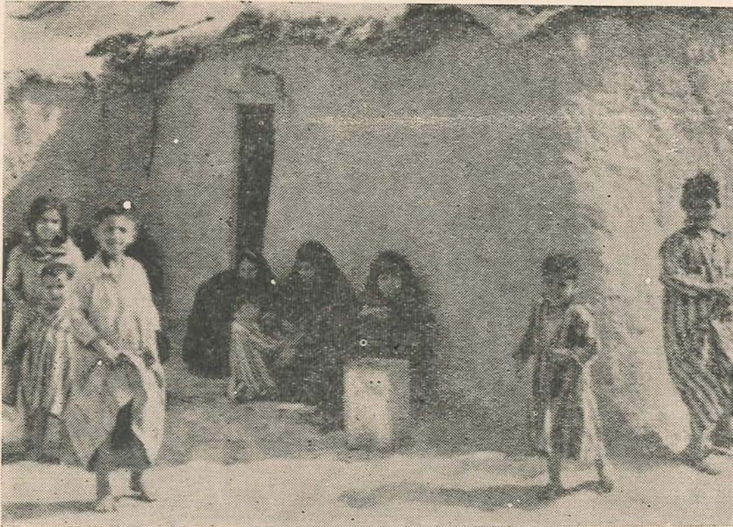
La Miseria, hecho común en muchas regiones del mundo.

De otro lado es bueno anotar que en gran parte este grado de organización puede explicarse por la tradición de solidaridad del campesino oriental al lado de su marcada individualidad.