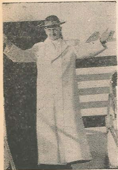
S.S. PABLO VI

Queremos sentir los problemas, percibir sus exigencias, compartir las angustias, descubrir los caminos y colaborar en las soluciones.