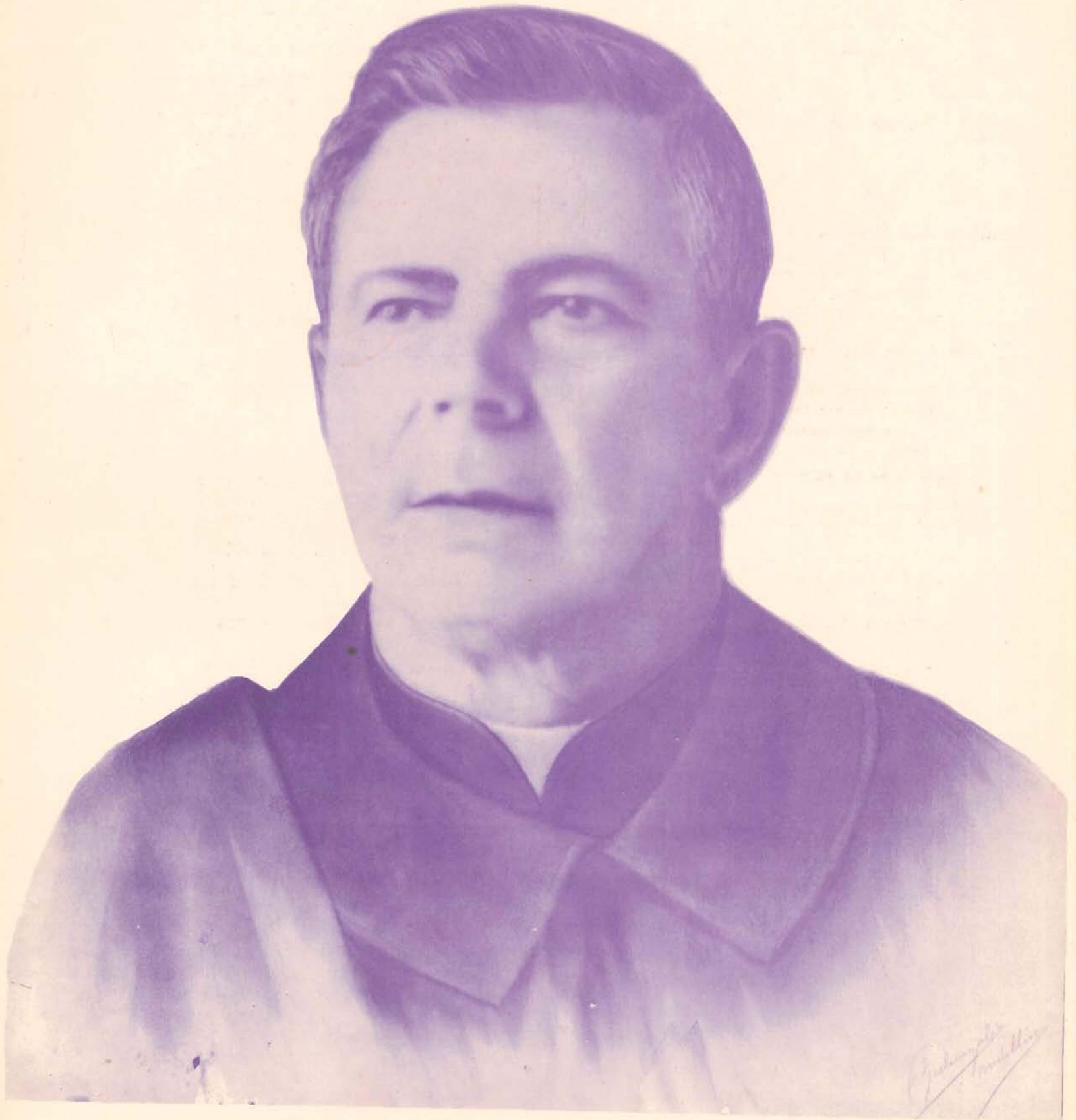
Monseñor Ignacio Botero Aristizábal

— Modelo de Sacerdote, la bondad hecha hombre —