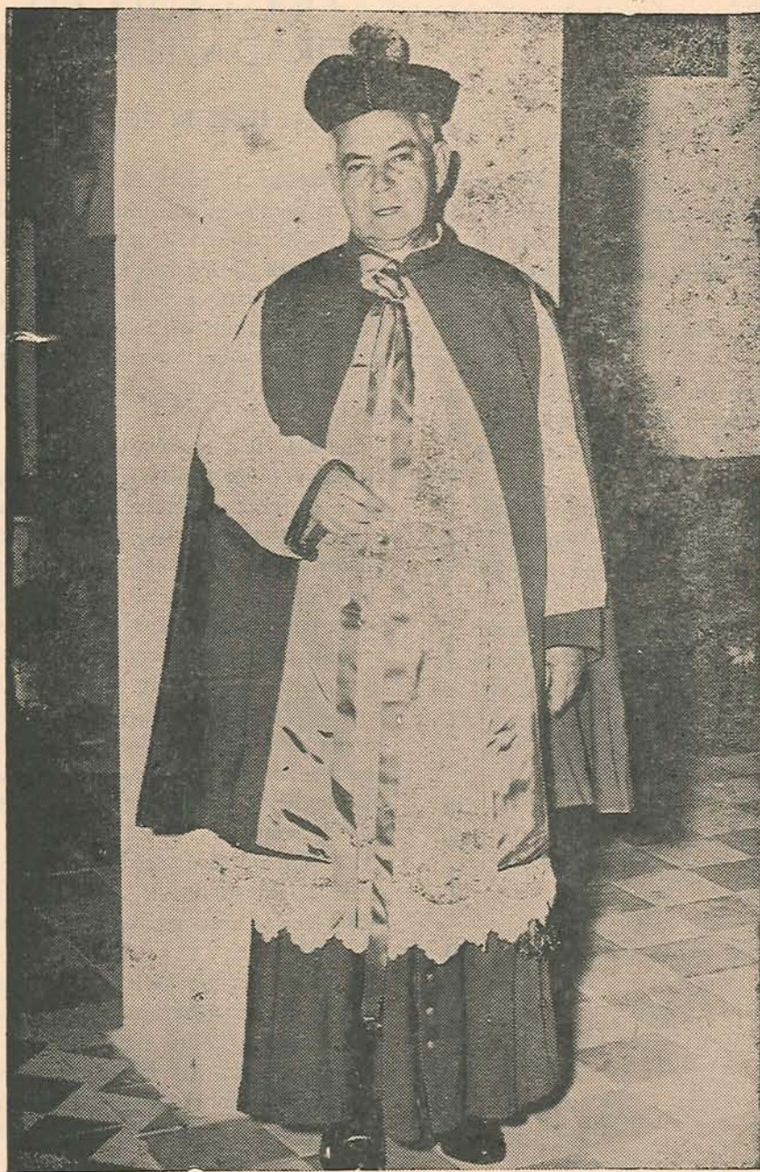
Monseñor Ignacio Botero Aristizábal