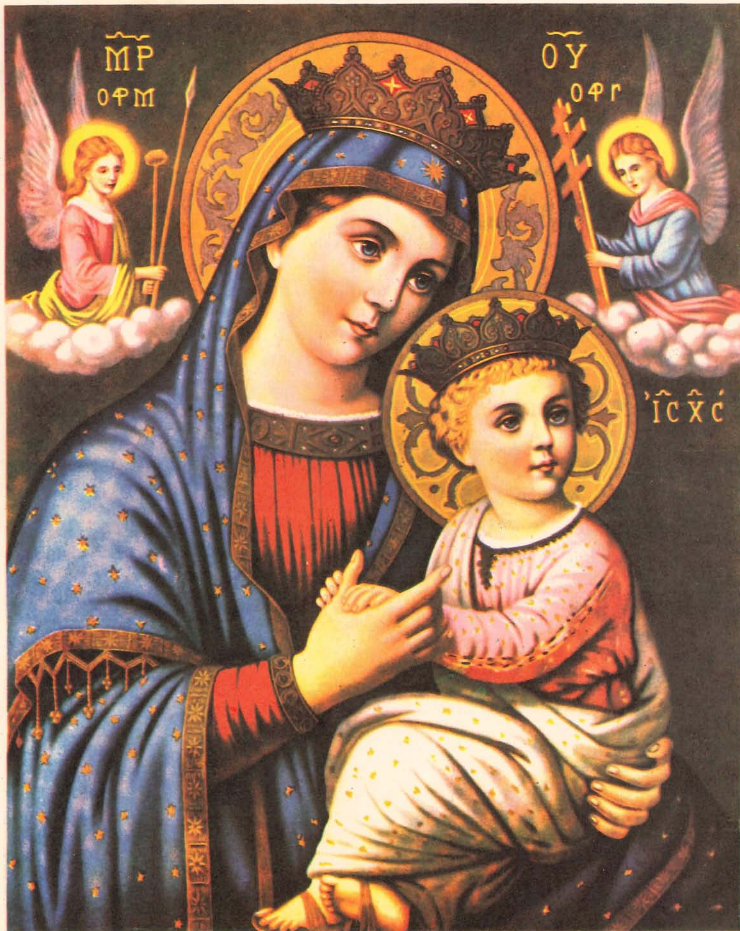
NUESTRA SEÑORA DEL PERPETUO SOCORRO