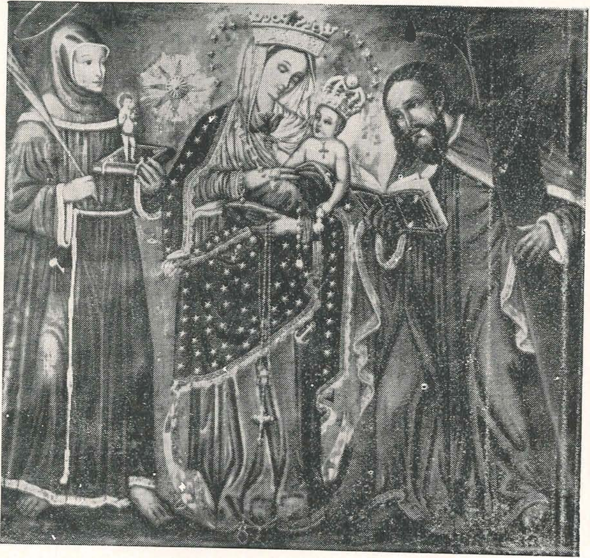
"EL SANTUARIANO" le rinde su filial y respetuoso homenaje a la Santísima Virgen, con motivo del Congreso Mariano que se ha iniciado en esta ciudad a partir del día de hoy.