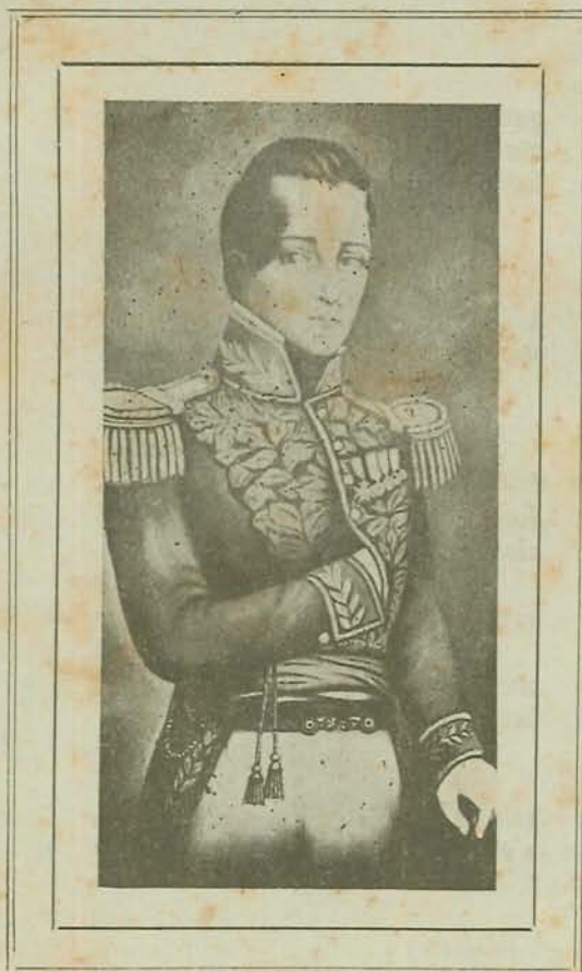
GENERAL JOSE Ma. CORDOBA

'El Santuariano' consagra la presente edición a este héroe extraordinario, en el primer centenario de su muerte, acaecida en esta ciudad el luctuoso 17 de Octubre de 1829.