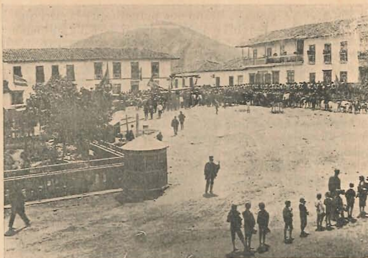
Desfile de Escuelas y Colegios el 17 de Octubre último, ante la histórica casa donde fue ultimado el Héroe de Ayacucho.