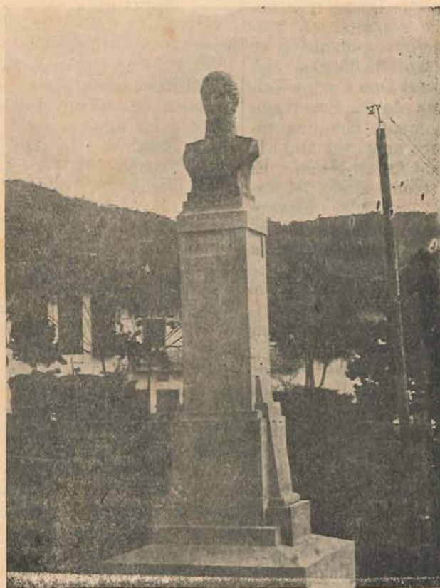
Busto del General Córdoba erigido hoy en la Plaza Principal, en el Parque que lleva su nombre.

Pasados estos combates recibió el encargo de libertar las montañas antioqueñas del dominio Ibérico. Entró por las montañas de Oriente. Los españoles huyeron y aquel joven que cinco años antes