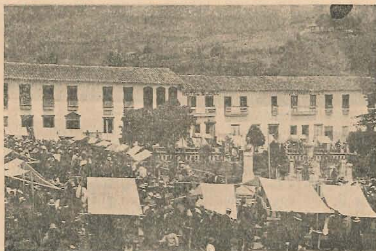
Obsérvese el busto del General Córdoba, en el costado Sur del Parque.

tan lamentable desgracia, por caridad y por evitar el escándalo que tal procedimiento produciría, debiera callarse. Y con tanto mayor motivo por cuanto personas dignas de crédito han asegurado que fué absuelto por el ya citado Pbro. Modesto Hoyos.