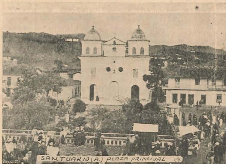
Plaza Principal. Santuario (A).